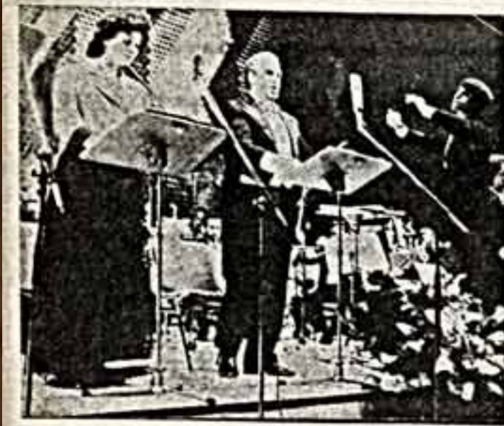
Концертное исполнение оперы М. Мусоргского «Борис Годунов» превратилось в истинный праздник для многочисленных любителей искусства Софии...