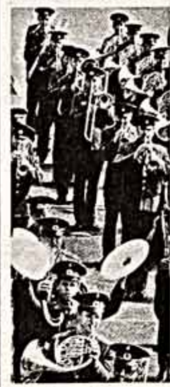
«Последняя реплика». (Играет соедный духовой оркестр Министерства обороны СССР).

Немало интересных сообщений поступит в эти преддверные дни в редакцию. С некоторыми из них, переданными корреспондентами «СЖ» и ТАСС, мы знакомим сегодня наших читателей.