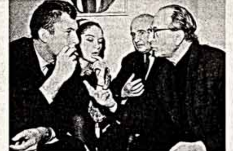
То — ей был нужен пафос классического быя, Юный Барабанчик и Трубочки Первой Конной. На скепников не было спросу...