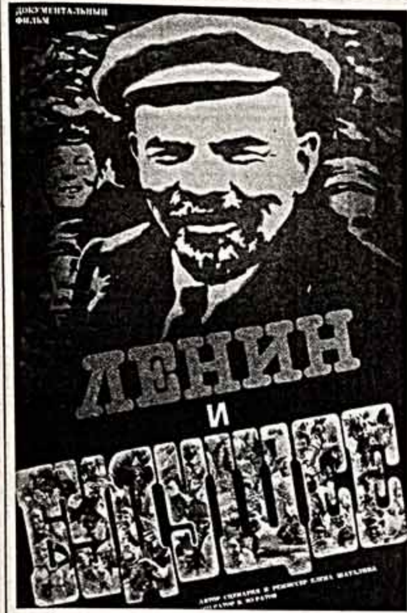
Плакат художника М. Гетмана.