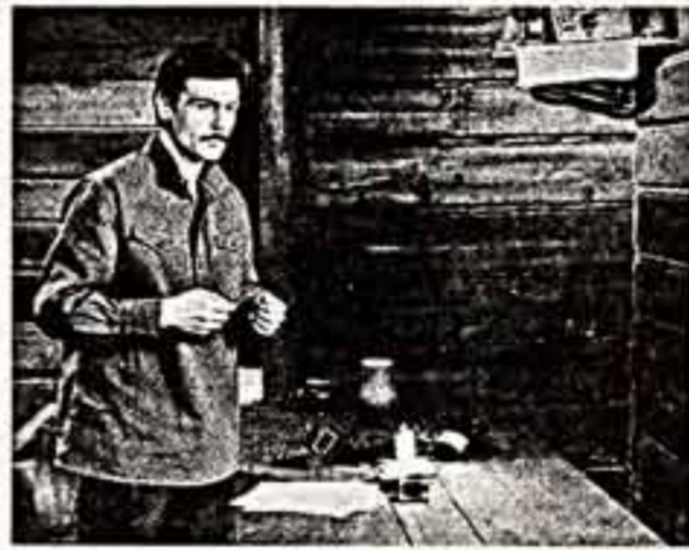
«Пять писем прощания».