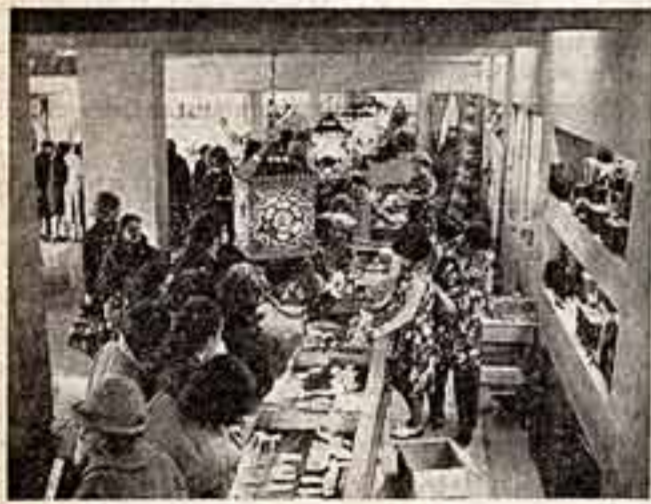
Магазин «Русские узоры».

Резные деревянные панно «Село Коломенское» выполнили мастера московского экспериментального творческого производственного объединения «Русские узоры».