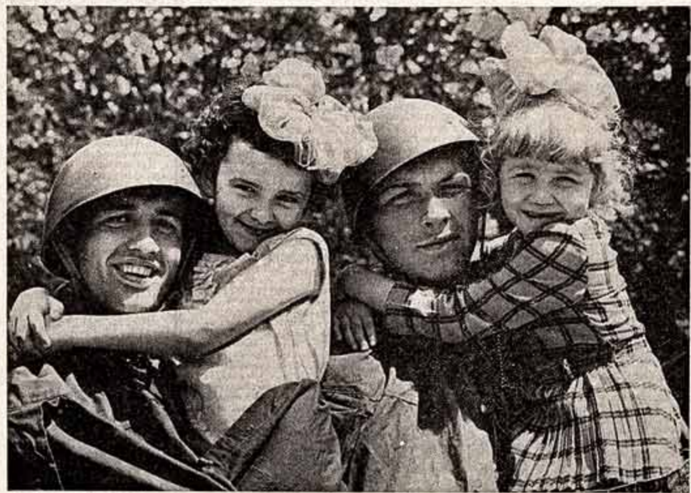
● Марта 31-я весна.

В День Победы наши воины, как и все советские люди, обращают свои взоры к родной Коммунистической партии — своему зоркому Главному руководителю, гениальному стратегу и полководцу, вдохновителю и организатору всех наших побед. Ведомые партией, осознанные необходимыми ленинским знаменем, Советские Вооруженные Силы вместе с армией братских стран социализма бдительно стоят на страже строительства социализма и коммунизма, всегда готовы соручить любого агрессора.