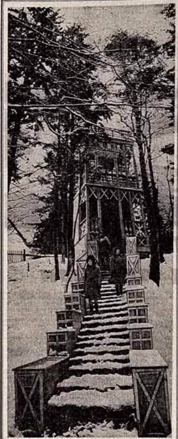
В репнских «Печатах» завершены работы по восстановлению «Вашкинг Шехерезады» на Чугуйской горе. Как известно, эта башенка построена по рисунку Н. Е. Репина.