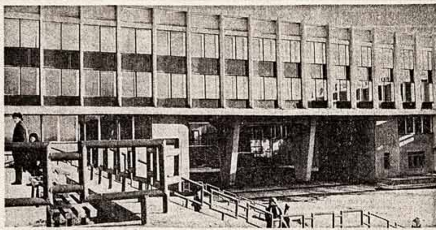
Новый Дворец культуры, построенный для труженников Гомельского химического завода. В красном просторном зале — концерт солистки Народного театра и танцевальной группы, библиотеки. Репетируют различные кружки художественной самодеятельности.

В нашей республике каждый достойный занимается тем или иным видом художественной самодеятельности. Не форсируя искусственно рост самодеятельных кружков, ансамблей, студий, мы рассчитываем, однако, на дальнейшее увеличение массовости народного творчества.