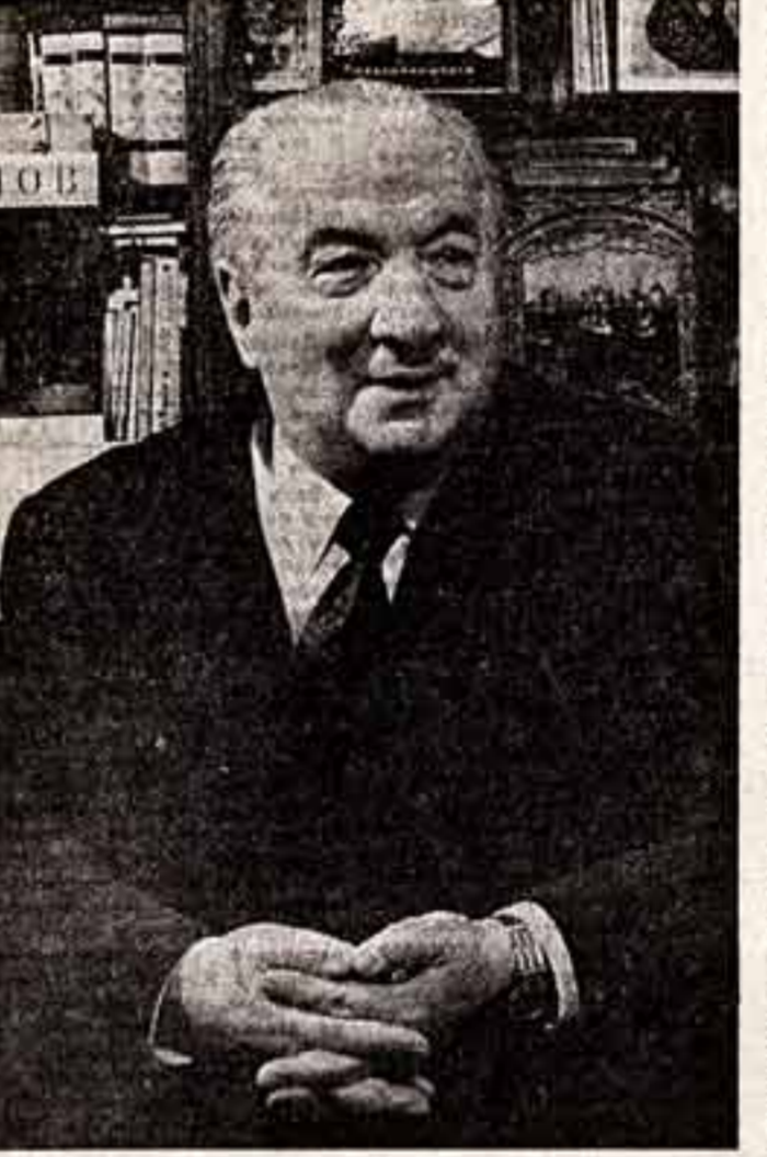
портретами людей двух веков, анализали в них. Они словно переполнились — мысленно — в персонажей больших полонет и нациных минатор. Художественный образ подобен мимому органу, если это в самом деле художественный образ. Он обладает способностью жить самостоятельной жизнью, как бы отделившись от прототипа, вобраза в себя его духовную сущность. Это объясняет также и «феномен Андроникова», чье творчество интересно зрителям недолговечными аудиторией ничуть не меньше, чем первым его зрителем-слушателем. Образ живет, как живет самостоятельный организм, если все в нем взаимосвязано, если часть образует целое, а целое формирует часть. Наше образное мышление непременно схватывает эту цельность, подобно тому, как игнорирование отличает живое от неживого, и испытывает наслаждение, проделав эту работу, тонкую операцию. Потому-то мы и можем судить, правдив ли образ. Правда, если живет своей жизнью.