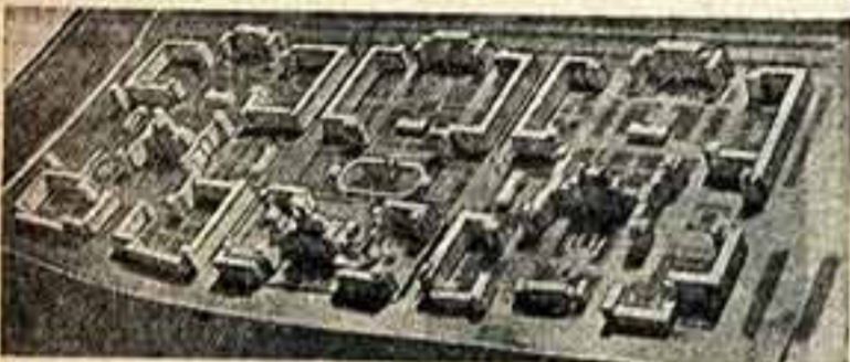
Макет застройки квартала по Фрунзенской набережной.

Архитектурный совет Москвы одобрил проект застройки квартала № 6 по Фрунзенской набережной (авторы — архитекторы Я. Белозерский и А. Стахов). Проектирование квартала представляет большую работу по созданию архитектурно-планировочной схемы всей Фрунзенской набережной — от Крымского моста до Моста Окружной железной дороги. Эта работа ведется авторами совместно с архитектором Н. Удалов в 3-й архитектурно-планировочной мастерской, где осуществляется проектирование всего юго-западного района столицы. Относительно под строительством территории, расположенная на