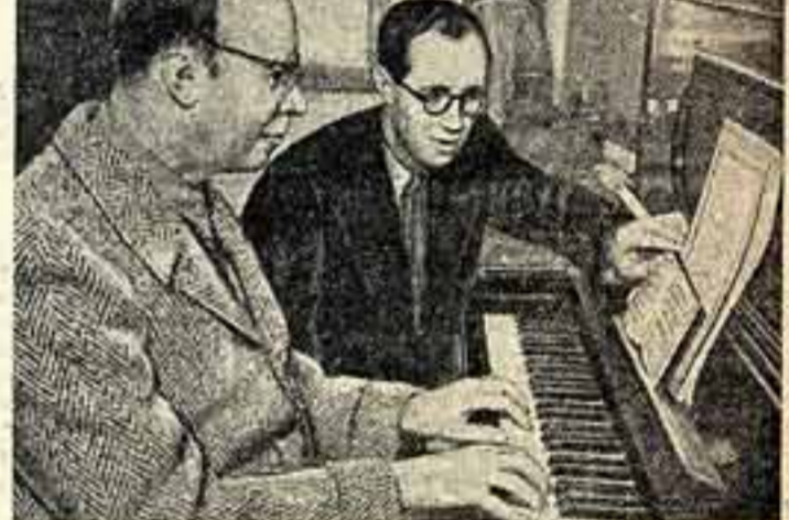
С большим увлечением работал Сергей Прокофьев над концертным для виолончели с оркестром. В своем произведении автор широко использовал русский народно-песенный музыкальный материал. Концерт создается в тесном творческом сотрудничестве с виолончелистом Метиславом Ростроповичем, которому он и посвящен. Такое сотрудничество помогло композитору воплотить богатейшие мелодические и технические возможности инструмента. К началу 1952 года концерт был закончен. В ближайшее время состоится исполнение нового произведения С. Прокофьева.