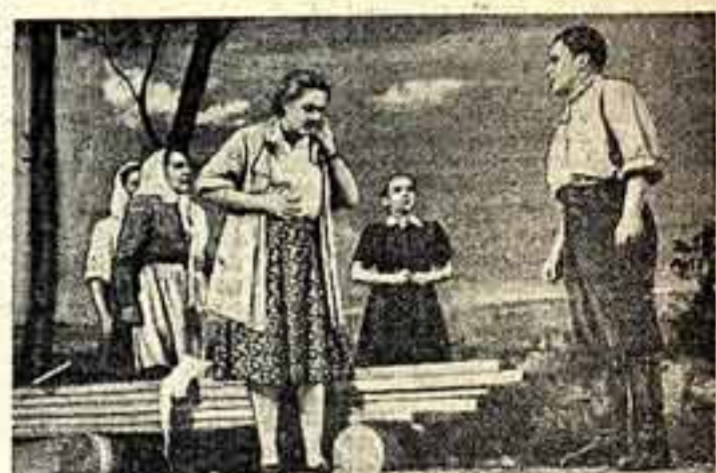
Московский театр юного зрителя подготовил для старших школьников новый спектакль — «Павло на счастье» Л. Гераскиной. Пьеса, написанная на материале жизни одного сибирского колхоза, рассказывает о формировании характера молодого руководителя, о непрямой роли партийной организации в воспитании молодежи.