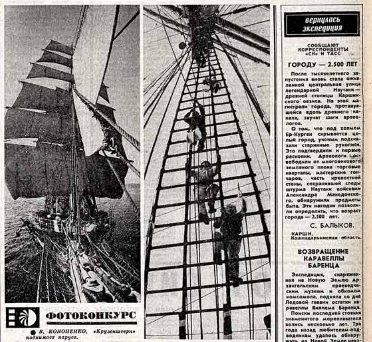
В. КОНОНЕНКО. «Кружакатери» поднимает паруса.