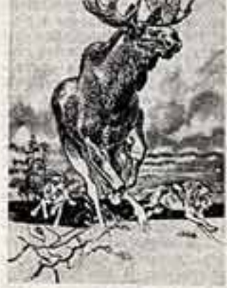
Рисунки В. Горбатова