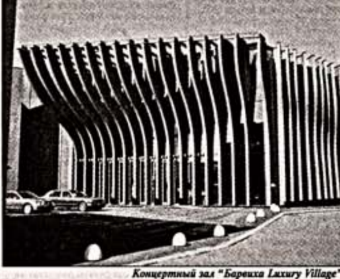
Концертный зал “Барвиха Luxury Village”