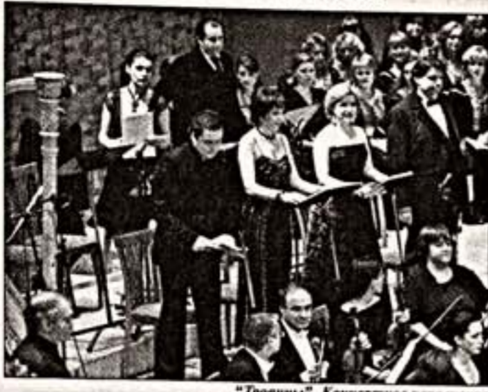
“Троянцы”. Концертное исполнение оперы Берлиоза на “Звездах белых ночей”

Свершилось: “Троянцы”, знаменитая оперная дилемма фактора Берлиоза, прошла в два вечера на сцене Концертного зала “Марининский”, став симфонией и музыкальной культурной “Звездой белых ночей”. Целостная, органично сконструированная опера, которую вывели на сцену с любовью, инвентаризацией любимых деталей, эстетическими симфоническими картинками и диалогом глазами и ушами, была проведена Валерием Ариевым на экстазическом подъеме и вместе с тем — удивительно сосредоточенно. Это был долгий, контролируемый разумом порыв, равно полярный на протяжении всей оперы.