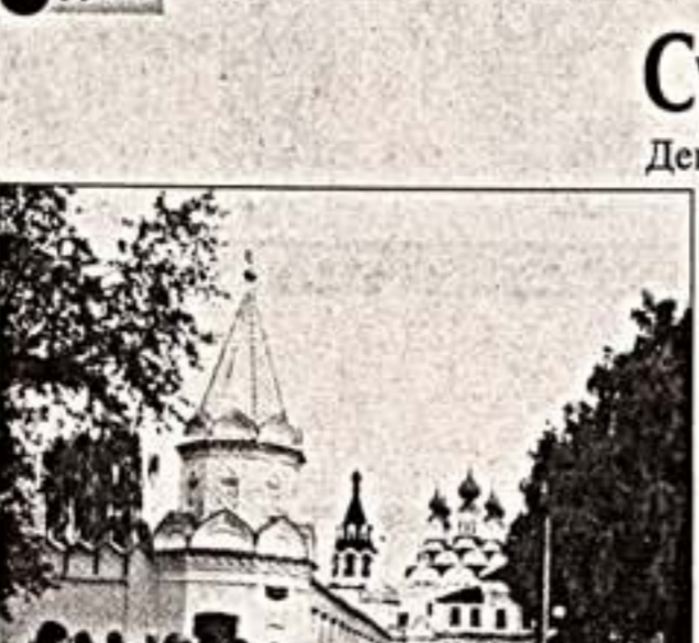
Слева: муромский Свято-Троицкий женский монастырь, где хранятся мощи благоверной цетмы. В центре: памятник Благоверным Петру и Февронии. Справа: День семьи в Муроме встречали под дождем