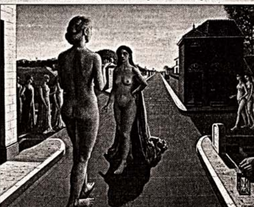
П. Дельо. "Встреча". 1942 г.