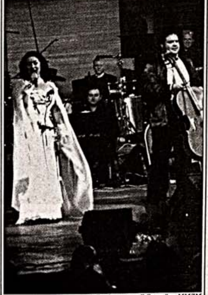
Гвердцители в Б.Струйбе в ММЦМ