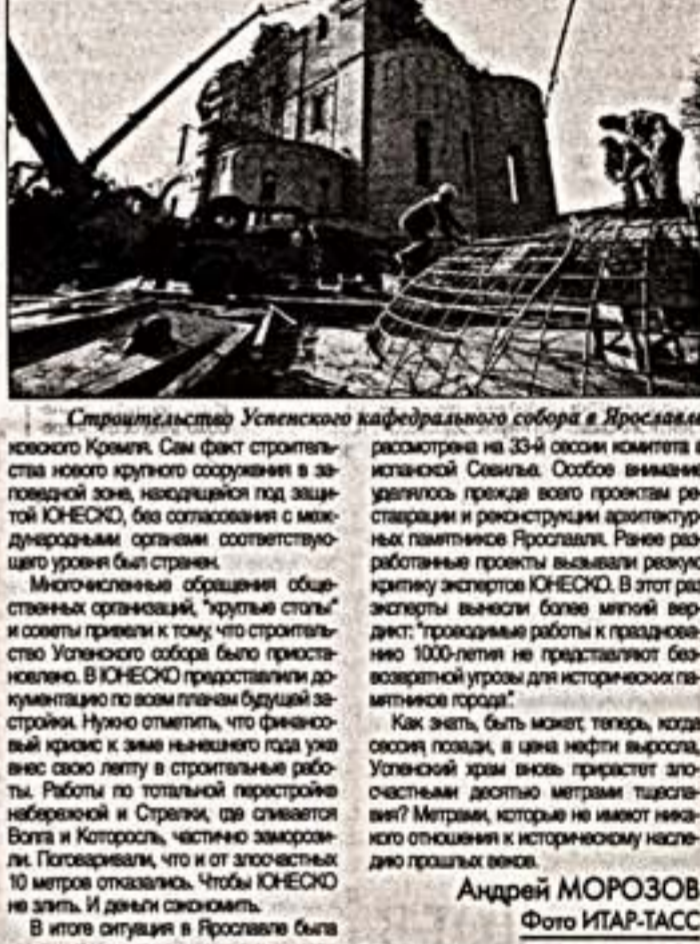
Строительство Успенского кафедрального собора в Ярославле