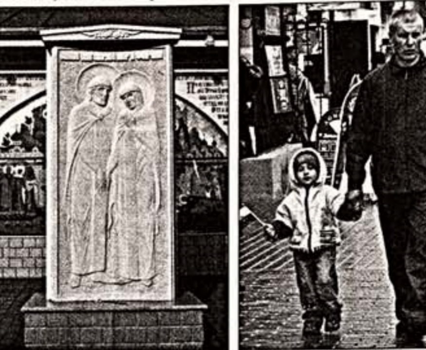
Слева: муромский Свято-Троицкий женский монастырь, где хранятся мощи благоверной цетмы. В центре: памятник Благоверным Петру и Февронии. Справа: День семьи в Муроме встречали под дождем

День семьи, любви и верности становится всероссийским