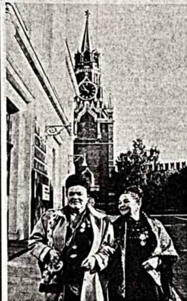
Награды — героям труда

турно-оздоровительной работы. Отмечу, что они приняты во всей стране, и главный их порок — ориентация на вал, на видимость массовости, а не на качество. Вот, снаем, главный, определяющий показатель: он учитывает количество занимающихся физкультурой. В процентах к численности трудящихся коллективов. Это можно считать как угодно. Отсюда любые приписки. Другой аршин — мерло материальной базы. Она может и не меняться с годами. Допустим, как было 9 бассейнов в прошлом пятилетке, так они есть и сегодня, а баллы за «хорошую» основу по-прежнему идут, хотя никакого развития не произошло. Могут ли такие мерки стимулировать развитие спорта? Разумеется, нет.