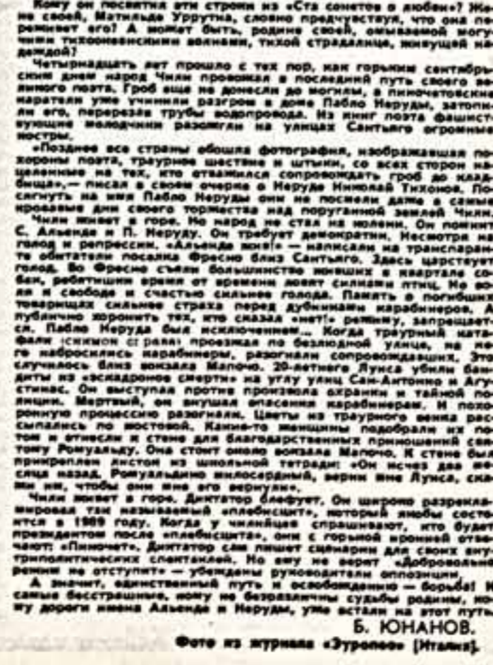
Б. ЮНАНОВ. Фото из журнала «Экспресс» [Италия].