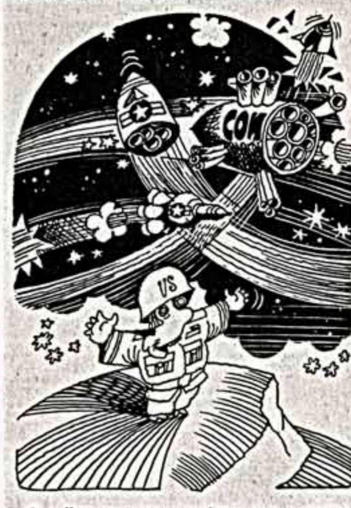
Име стремление к воздушному лиру с помощью воздушных войск не имеет границ! Рис. В. Арсеньева.