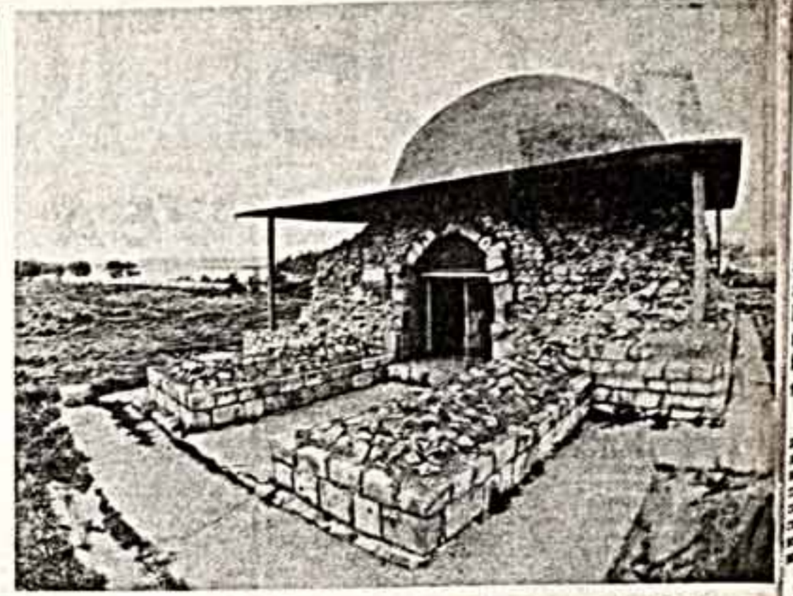
На высоком берегу Волги, неподалеку от места ее слияния с Клязьмой находится один из замечательных памятников истории — Волгарское городище. Столица одного из раннегосударств Восточной Европы — Волжско-Камской Болгарии — впервые возникла здесь в начале X века н. э. На территории древнего Волгарского городища сохранился ряд уникальных архитектурных памятников.

Б. СОКОЛОВ, директор Куйбышевского книжного издательства