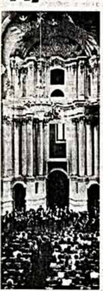
...500-й концерт в Софии Полоцкой. Играет государственный камерный оркестр «Виртуозы Москвы» под управлением народного артиста РСФСР В. Славянова.

Вспомнилась в лица великих, которых дала миру эта земля. Полоцкая княгиня Предслава, в монашестве Ефросиния, чьями стараниями распространялось образование в русских землях и был возведен храм Спасо-Преображения, ставший жемчужиной отечественного водчества. Франциск Скворца, первопечатник, давший своему народу первую книгу на родном языке. Симеон Полоцкий, первый русский профессиональный писатель, прос-