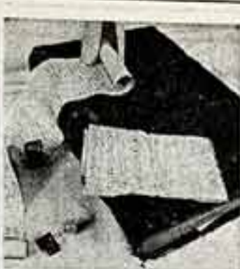
Научная библиотека Томского государственного университета имени В. В. Куйбышева...