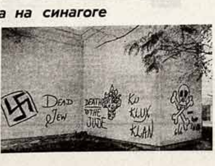
США: свастика на синагоге