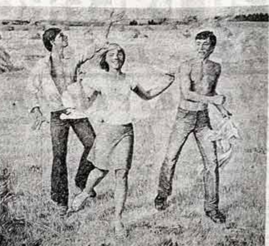
В. ТРОФИМОВ. «Юность»