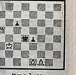
Мат в 2 хода