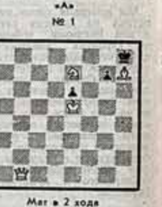
Мат в 2 хода

Соревнования в нашем осеннем конкурсе могут все же желать, в том числе и ранее не участвовавшие.