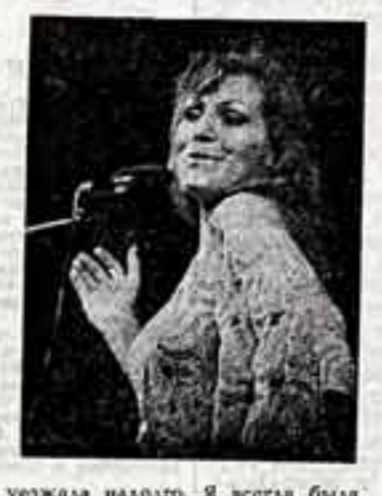
ОТРЫВОК ИЗ КНИГИ