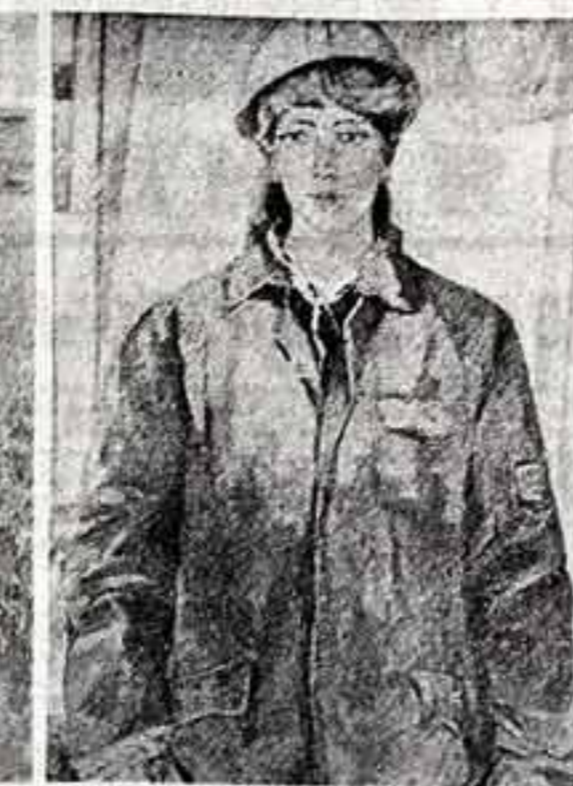
Г. МОЛОТКОВ. «Поэзия»