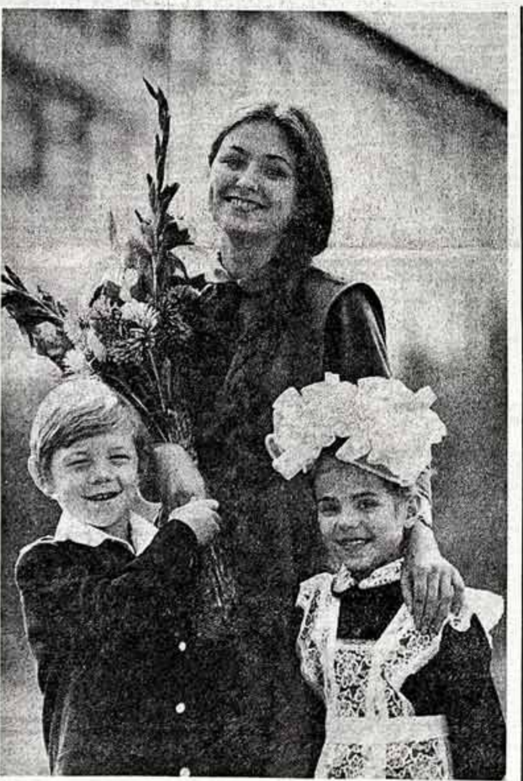
Все вместе — в первый класс.