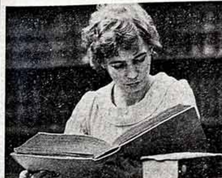
В научной библиотеке университета, в отделе редких книг рукописей. Идет лекция на медицинском факультете.