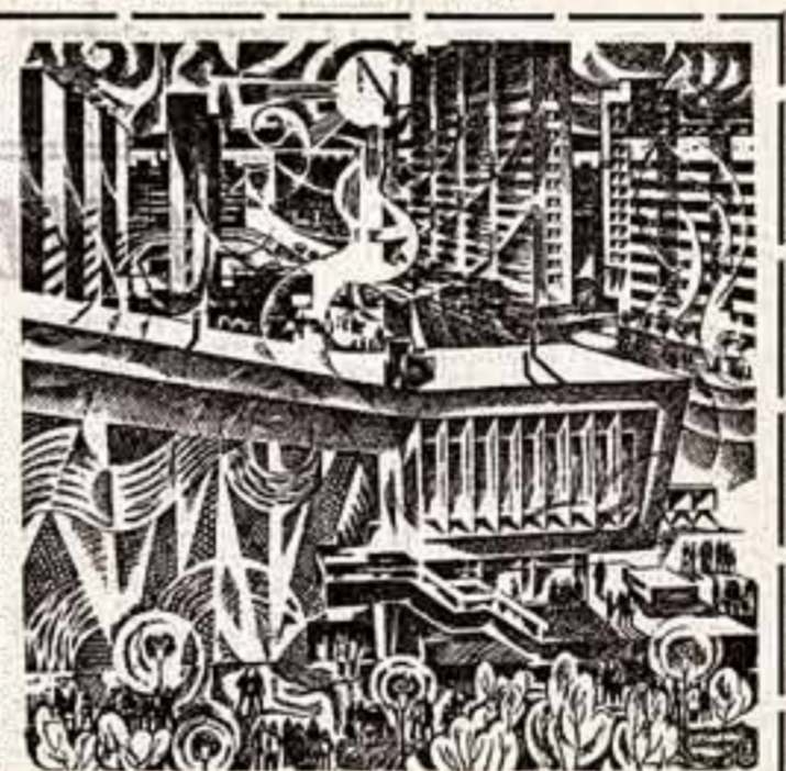
«Строители» и «Город Тольятти».