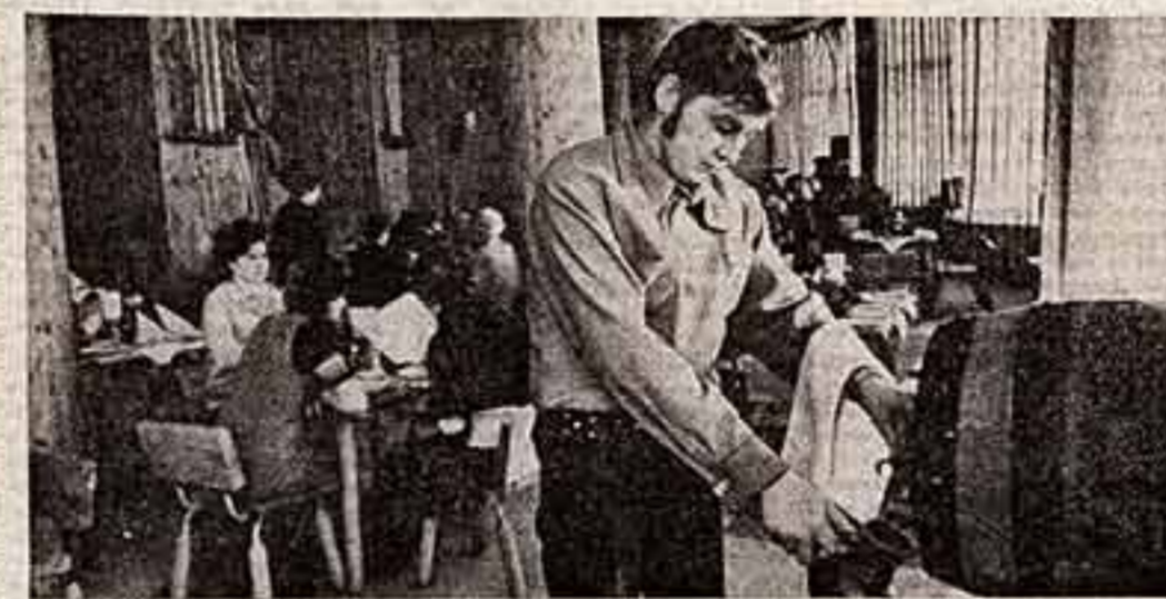
Многие жители Урала и Сибири...