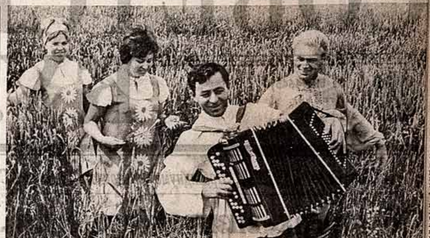
На полвек стаж. (Агитбригада Крымского районного дома культуры Краснодарского края).