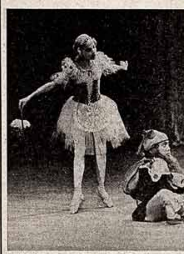
В столице Казахстана состоялся очередной отчетный концерт выпускников Ала-Аттинского республиканского хореографического училища. Театры республики получают много пополнения.