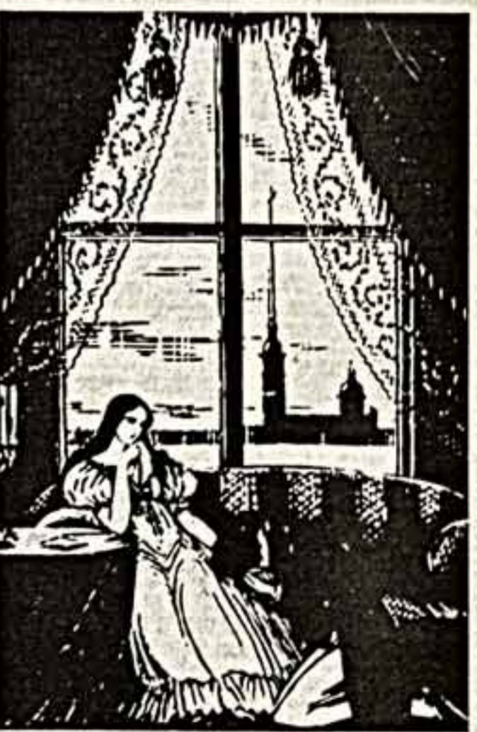
А. Вену, Петрушка. Н. Вену, Свадьба у царя Салтана. М. Добужинский, Принцесса и ее свита. Девять варшавских иллюстраций и эскизы Х. К. Андерсона «Сказки».

«Россия» висела в Лондоне. Картина довольно большая, никакой загроможденной музейными экспонатами, в квартирах западных коллекционеров вряд ли есть такие огромные «пустые места».