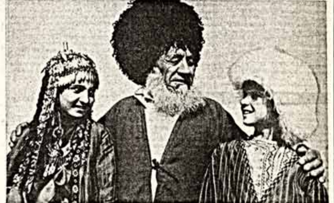
● Президент Туркменистана С. Ниязов: «Я такой же туркмен, как и все». ● Знаменитый ковчего-изант, ялод рукотворного труда прославленных ковчегов Туркменистана. ● Каракумская надобна. ● Студенты Ашхабадского университета — дети разных народов. ● У памятника Махтумжули. ● За добрым советом — и аксакалу.