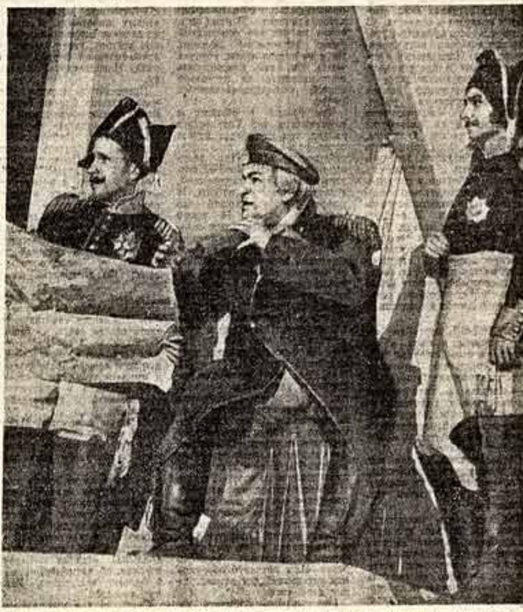
На снимке сцена из представления «Увеченные славой». В роли Кутузова — народный артист РСФСР А. Хохлов.

Вчера в Государственном комитете Совета Министров СССР по культурным связям с зарубежными странами начались датско-советские переговоры по вопросу о расширении культурного сотрудничества между Данией и Советским Союзом. Советскую делегацию на переговорах возглавляет председатель Государственного комитета Совета Министров СССР по культурным связям с зарубежными странами С. К. Романовский.