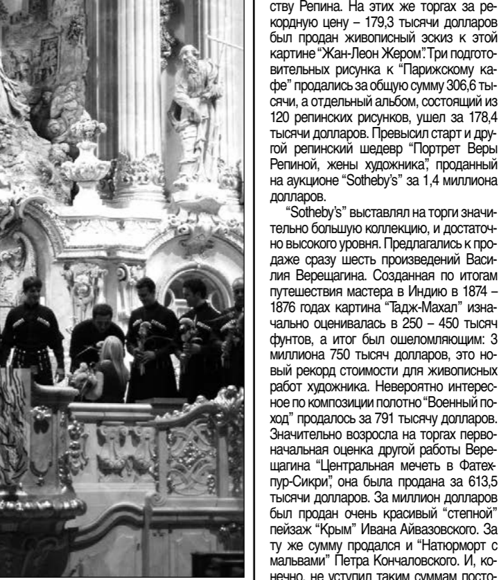
Хор Рустави во Фрауенкирхе