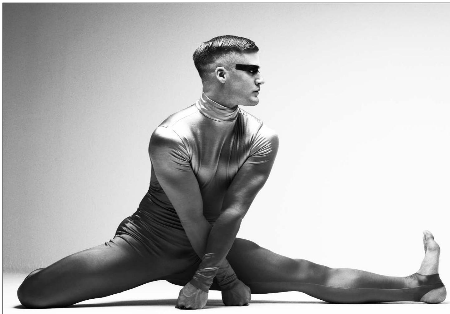
Архист труппы М. Кларка

Майкл Кларк представил в музее "Тейт Модерн" очередной перформанс с непрофессиональными танцорами