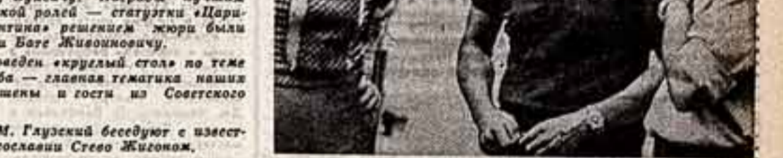
Встречи с В. И. Лениным