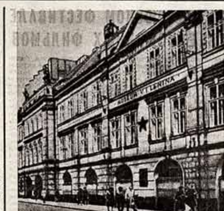
Встречи с В. И. Лениным