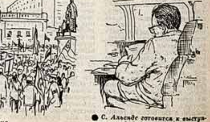
С. Альенде готовится к выступлению перед рабочими.