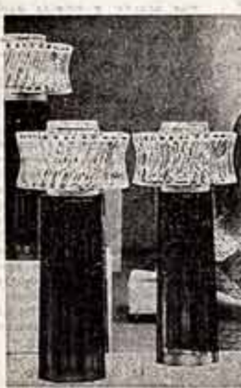
качество — знак времени

Таки показали своих художников Литве крупнейшие и старейшие русские заводы — Гусь-Хрустальный, Дятьковский, Ленинградский. Такую названную точку отсчета предложили для соревнования литовским коллегам... У Вильнюсского дворца выставок не подвезли — подавали записки, где до поры собирают и хранят произведения современных художников. Туза спустились стеклоделы России, чтобы увидеть работы Границы Диджонайтиса — первое литовское художественное стекло. Его еще мало. Но оно не робкое, не беспомощное, не примитивное. Мы увидели художника очень молодого и очень романтичного, который прислушивается к работам мастеров, жадно впитывает