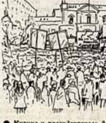
Митинг у президентского дворца.

Сегодня в выставочном зале на улице Горького, 25 открылась выставка работ И. Глазунова «Чили под знаменем Народного единства».