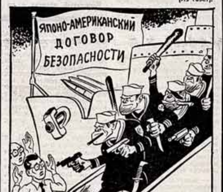
— Ну, кому тут обеспечить безопасность? Рис. Бор. Ефимов.