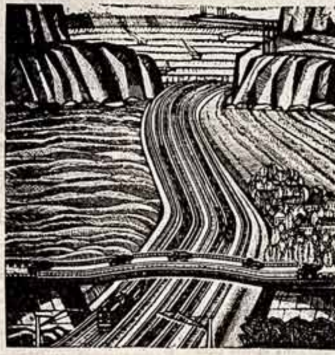
ГОТОВИМСЯ К ВЕЛИКОЙ ДАТЕ

Постановление ЦК КПСС показывает пути совершенствования коммунистического воспитания трудящихся, способствует повышению эффективности идеологической работы.