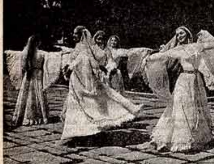
Далеко за пределами республики известно мастерство артистов ансамбля танца «Вайнак» Чечено-Ингушской АССР. Коллективу предстоит трехнедельная гастрольная поездка по странам Африки: в Мозамбик, Уганду, Кению, Эфиопию, Сомали и Танзанию.

Л. АЛЕШИНА, главный редактор Ленинградского телевидения.