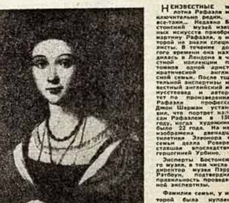
Неизвестная картина Рафаэля. Портрет герцогини Урбино кисти Рафаэля.