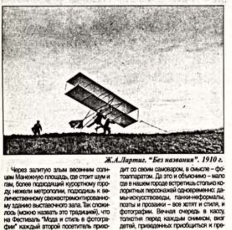
Ж.А.Лартиг. "Без названия". 1910 г.