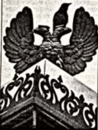
По традиции центральное событие дня - вполне торжественная церемония...