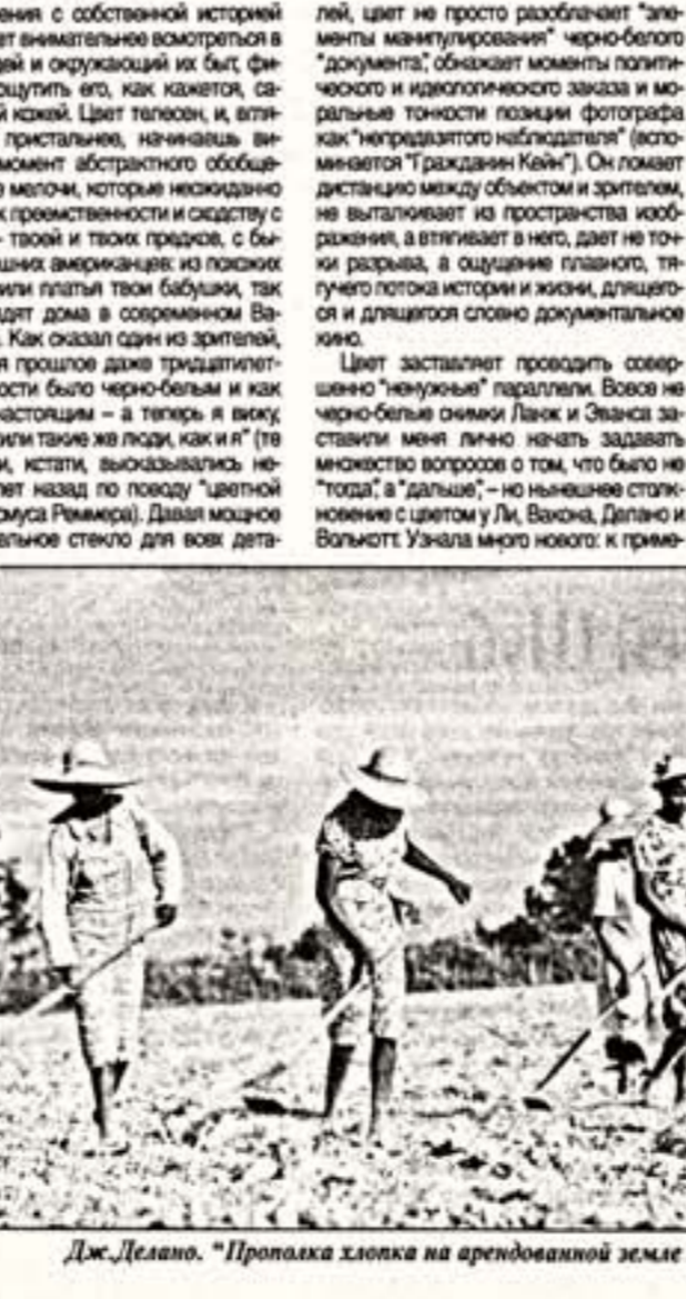
Дж.Делано. "Пропаханка хлопков на арендованной земле недалеко от Уайт-Плейнс". 1941 г.