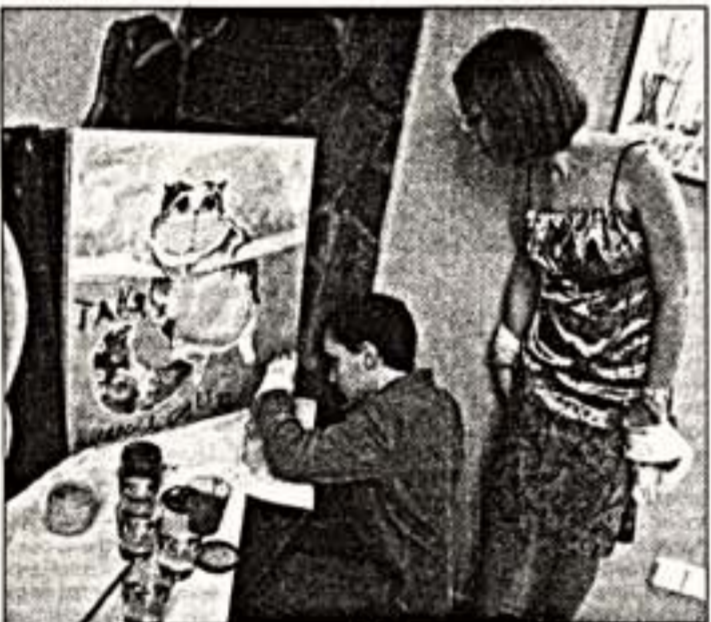
На занятиях в "Школе доброты"