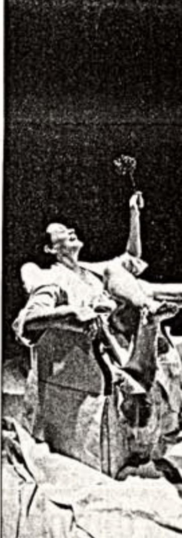
Сцены из спектаклей "Impressing the Csar" и "Last Touch First"