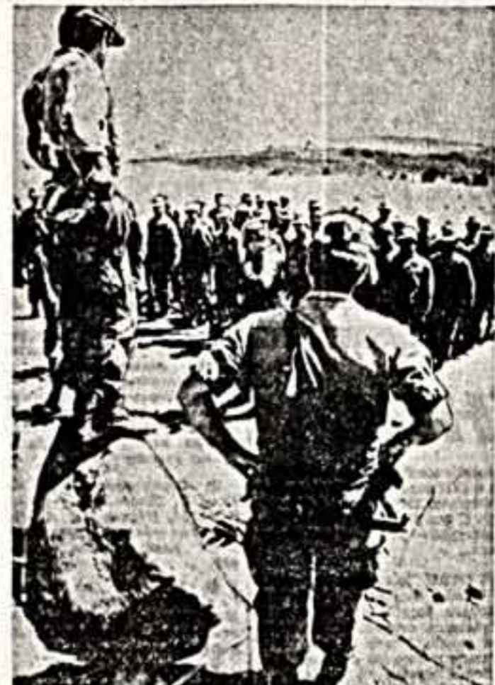
США продолжают поддерживать сальвадорских правительственных войск в Центральной Америке...