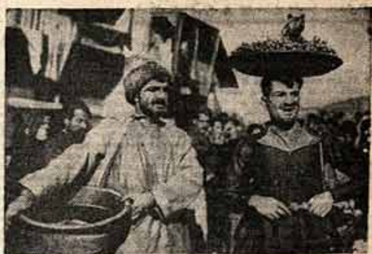
Кадр из фильма Армения «Паро»