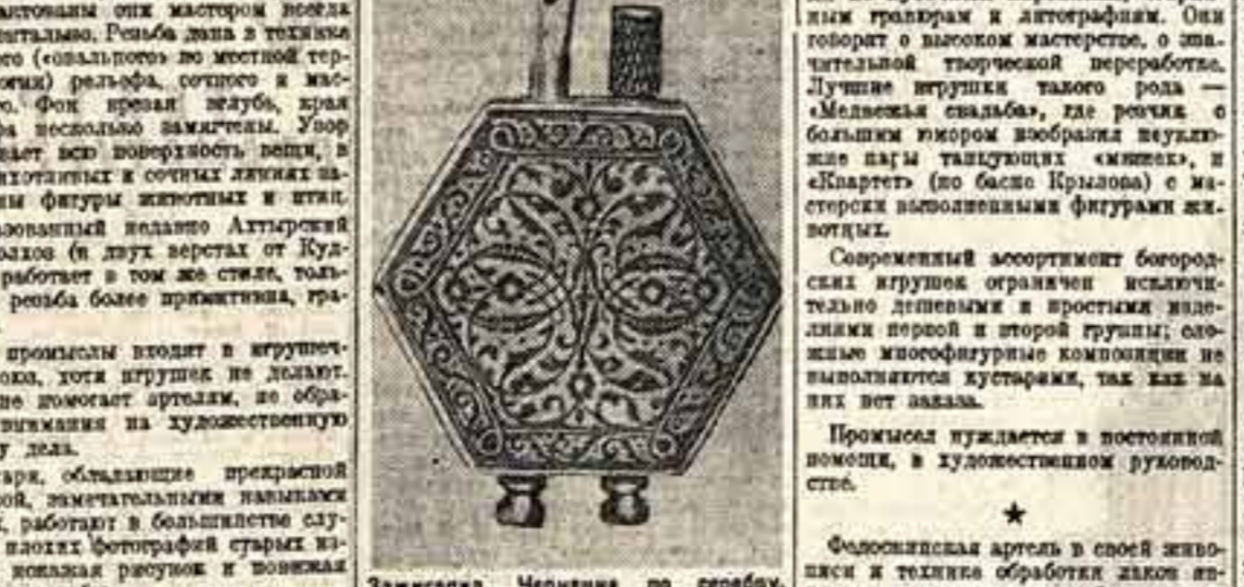
Зажигалка. Чертежи по серебору. Дагестан, вул Кудача.