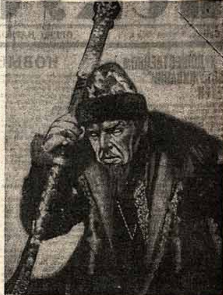
Грозный — арт. Г. М. Васильев

«Воронежский Большой театр пока- зал один из лучших спектаклей провинциальных театров...»