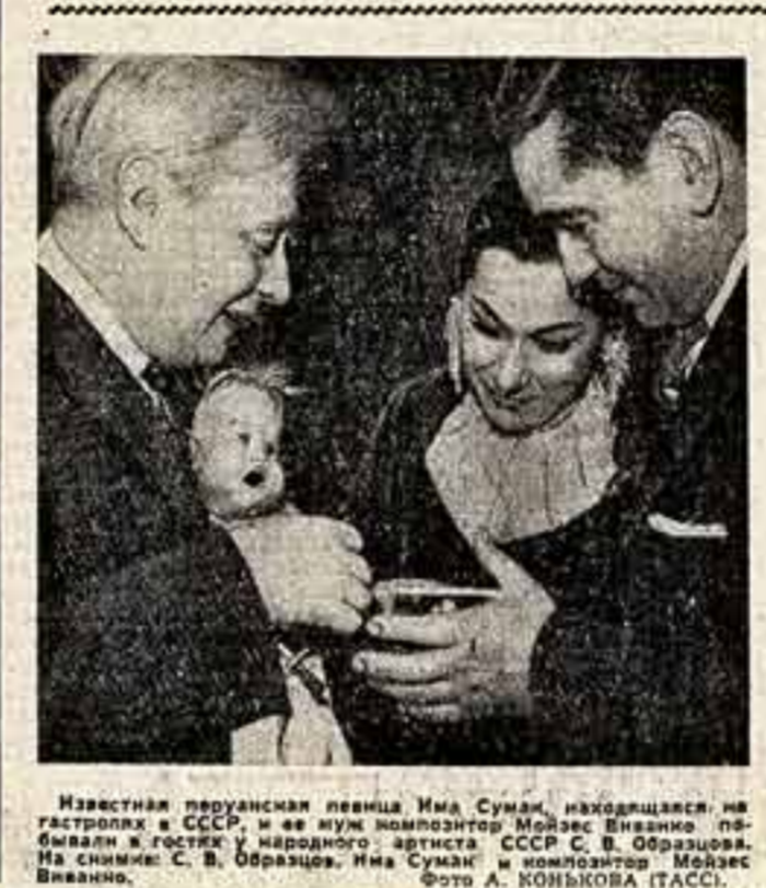
Известная перуанская певица Ина Суан, находящаяся на гастролях в СССР, и ее муж композитор Мойсес Виваню.

Странное чувство охватывает тебя, когда вступаешь в страну, казалось бы, такую знакомую, но воспринимаемую тобой с прощанием на десятилетия.