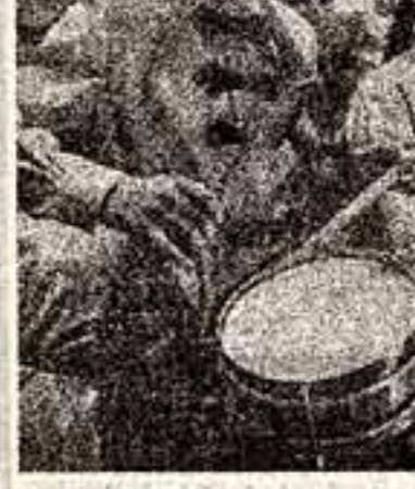
Ставропольский хор мальчиков «Юрты» исполняет не только в своем родном крае. Юные артисты горячо аплодировали в Москве, они пели во Дворце пионеров на Ленинском проспекте. Большим успехом пользовалось выступление коллектива на всесоюзном пионерском лагере «Облаков».

В субботу в Яте начнется праздничная программа, посвященная 50-летию ВЛКСМ. В нем примут участие солисты Большого театра СССР, артисты Москонцерта, певцы Армянки, Молдавии, солдаты