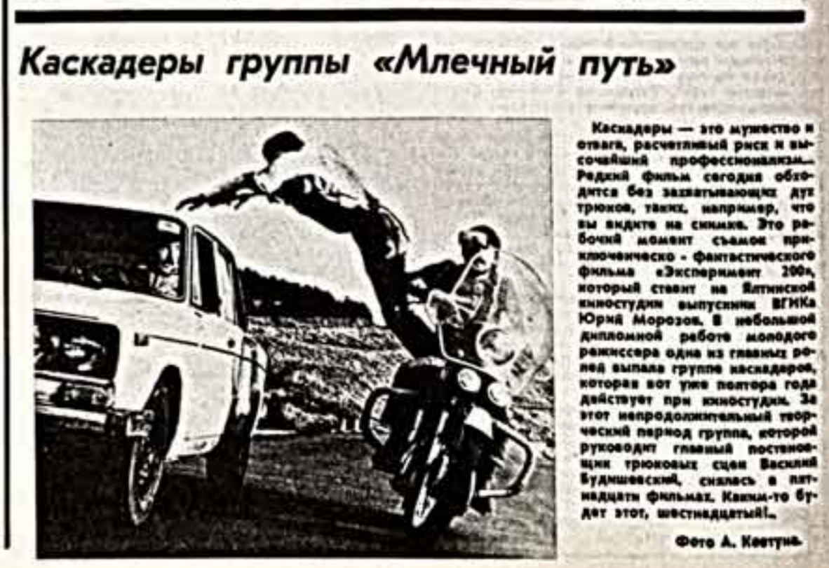
Каскадеры группы «Млечный путь»

Воспримчивость к научному кино в последние годы заметно снизилась. Сказано, не зная заранее, что такие известные деятели, как «Плохой» и «Госпожа Тулара» — «Илья» — сняты красносельскими документалистами, можно было без всякой натяжки зачислить их в разряд научно-популярных.