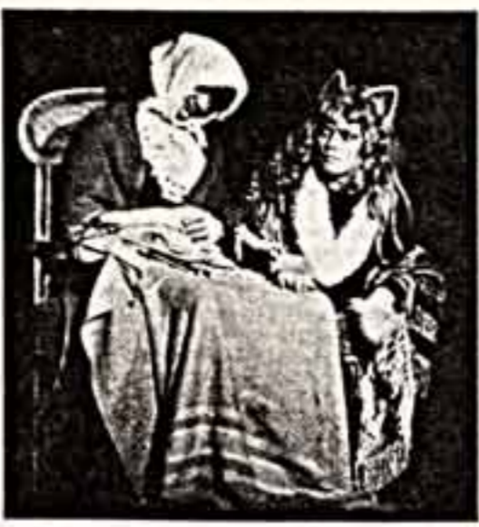
Сцена из пьесы «Брызги».