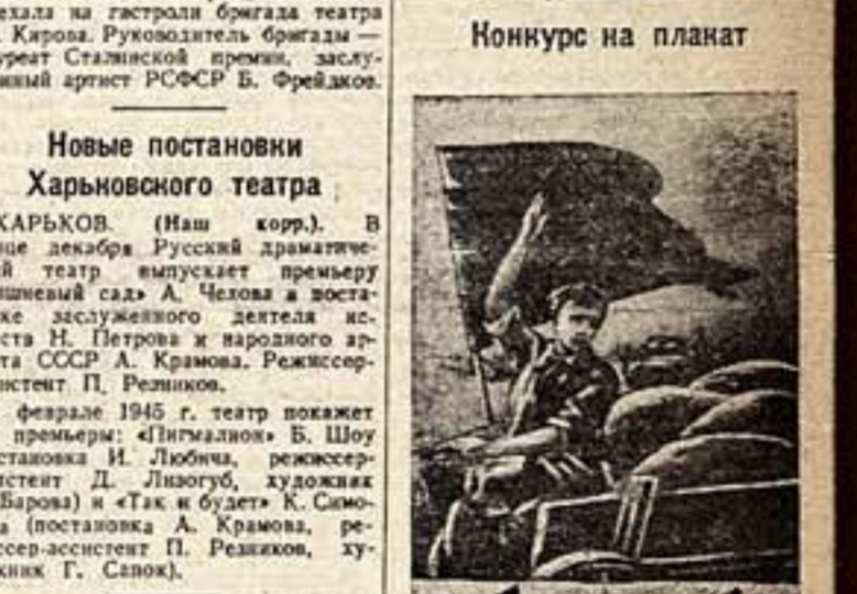
Конкурс на пекать

Вчера в Московском Доме архитекторов открылось первое Всесоюзное совещание руководящих работников республиканских управлений по делам архитектуры и главных архитекторов крупнейших городов страны. Совещание пролится несколько дней. На нем выступят руководящие работники республиканских и местных органов Комитета по делам архитектуры, главные архитекторы городов, представители наркоматов в ведомств, Академии архитектуры СССР, союза советских архитекторов СССР и других организаций. В залах Дома архитектора, где проходит работа совещания, открыта большая выставка проектов планировки восстановительных городов и сел, жилых и гражданских зданий, материалов по строительной технике, художественной промышленности, охране памятников архитектуры.