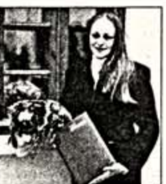
Молодое поколение Липицко театра получает диплом лауреата конкурса