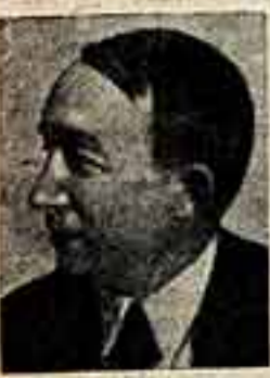
Н. И. Якушенко

Председатель Президиума Верховного Совета СССР К. ВОРОШИЛОВ. Секретарь Президиума Верховного Совета СССР И. ПЕГОВ. Москва, Кремль, 19 января 1955 г.