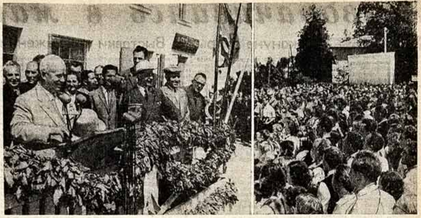
В столице Советской Латвии гостила с дружелюбным визитом партийно-правительственная делегация Германской Демократической Республики. Латвийский народ оказал гостям сердечный братский прием. Первый секретарь ЦК ЦКП В. Ульбрихт и Председатель Совета Министров СССР Н. С. Хрущев с группой членов партийно-правительственной делегации ГДР посетили колхоз «Сарманы Октября» Цесенского района Латвийской ССР. На первом снимке: массовый митинг на площади колхозного поселка. 12 июня почтительные гости вылетели самолетом на Украину и в тот же день прибыли в Киев.

Э. СМИЛЬГИНС, народный артист СССР, РИГА.