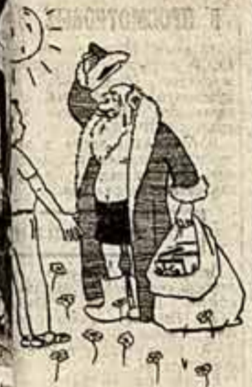
Рисун Е. ГУРОВА.