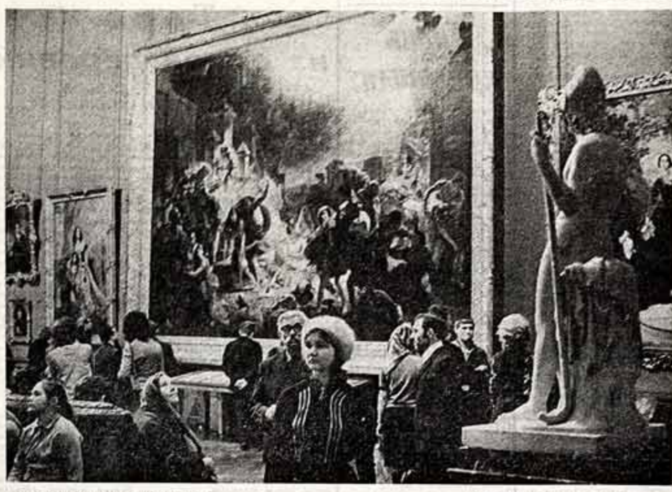
В Русском музее в Ленинграде.

«В театре вы были моим наставником. Я многим вам обязан и никогда этого не забуду».