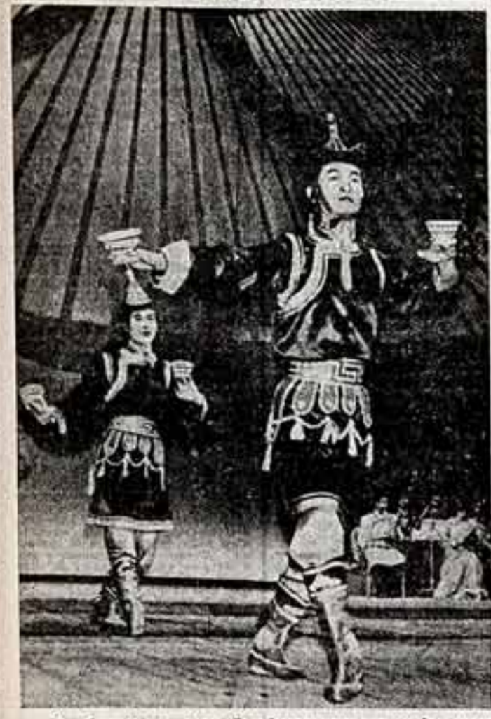
Сажобитное искусство Государственного ансамбля песни и танца МНР известно далеко за пределами страны. В этом году коллектив подготовил новую концертную программу. Она включает в себя фольклорные жанры, собранные во время творческих поездок по альпакским странам.

Национальный танец с чашкой в исполнении артистов Государственного ансамбля песни и танца МНР.