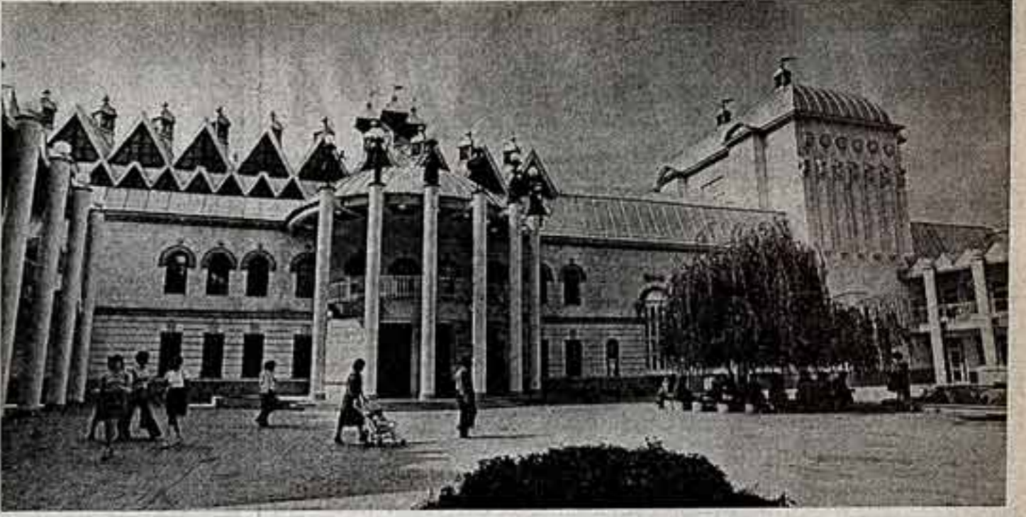
Настоящий дворец вырос на проспекте Революции — и никак не было похоже на дворец...