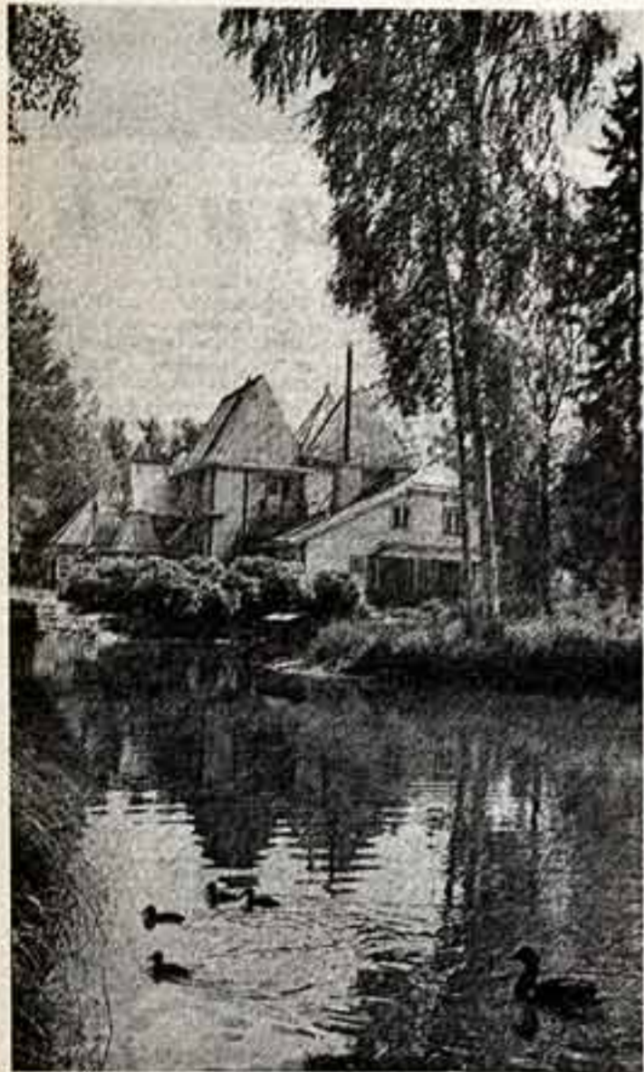
Мировая общественность недавно отметила 140-летие со дня рождения выдающегося русского художника Ивана Ефимовича Репина. В музее-усадьбе И. Е. Репина «Пенаты».