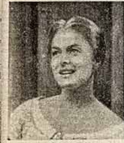
На сцене Гилфордского театра (Южная Англия) успешно идет пьеса Тургенза «Мисси в деревне»...