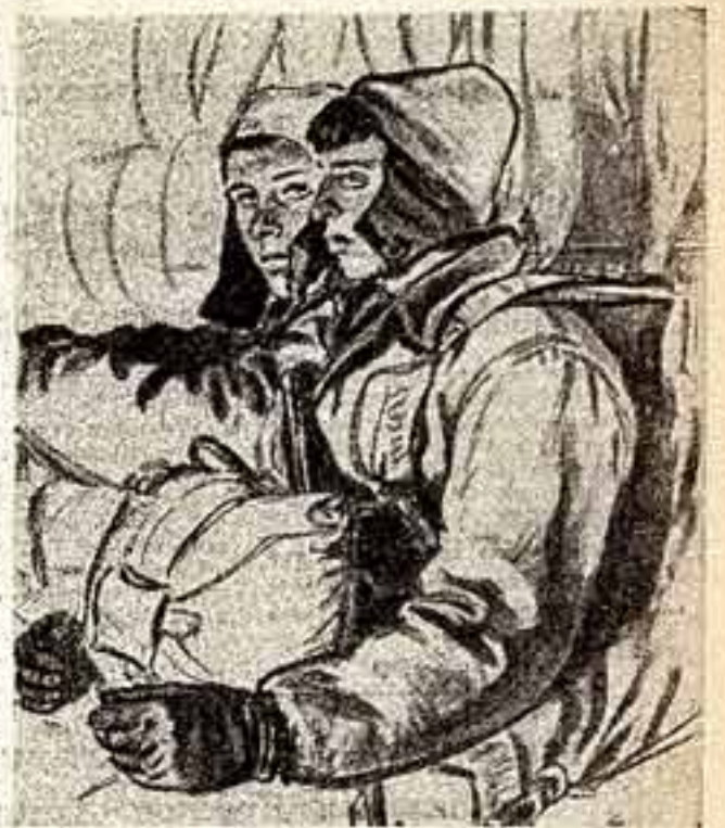
«Стократ блажен союз мечи и лиры» — высокие слова поэта неотлучны от всего духа нашей армии. И в пору минувшей войны, и ныне, в дни мира, радостно с победоносным оружием было и есть искусство, прославляющее тех, кто держит в руках оружие.