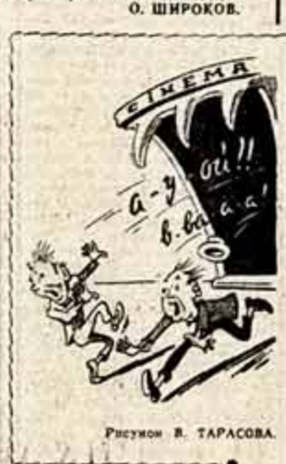
Рисунки В. ТАРАСОВА.

Стерея традиция — присваивать самой красивой девушке в Гаване имя «королевы карнавала». Королевы Нет, это звучит сейчас несоразмерно. С 1963 года