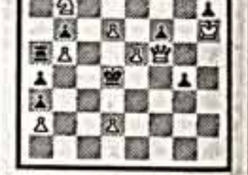
Мат в 3 хода