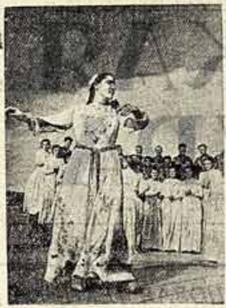
В Батуме состоялся смотр народного творчества Аджарии. На сцене выступают танцевальная группа ансамбля песни и пляски районного дома культуры села Хуло.

Б. СТАЛЬБАУМ, спец. корр. «Советской культуры», ЯРОСЛАВЛЬ.