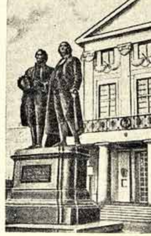
Здание Неметского национального театра в Веймаре. На переднем плане — памятник Гёте и Шиллеру.

сказать, что жизнь Германской Демократической Республики находит верное и достойное отражение в нашей драматургии. Не говоря о том, что авторы пьес охотно обращаются к исторической тематике, их произведения часто к тому же недостаточно оплотнены. Чувствуется нередко и слабое умение писать для сцены, и недостаточное проникновение в материал. Работники те-