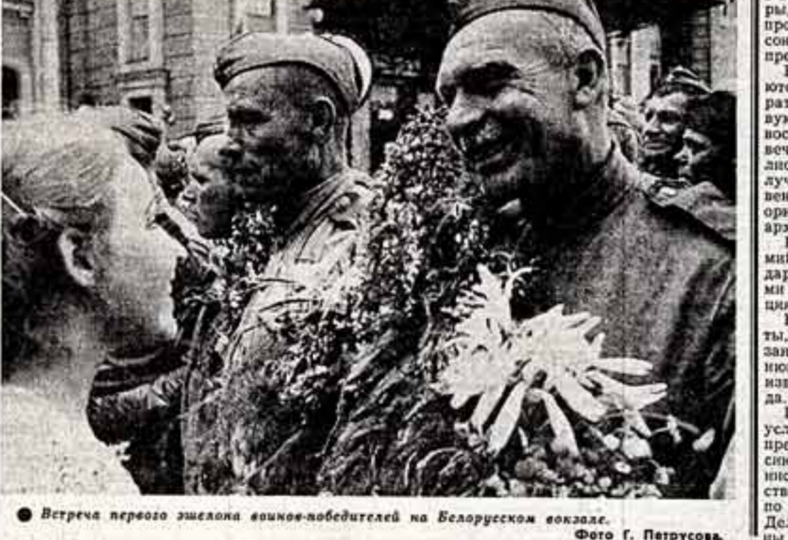
Встреча первого эшелона воинов-победителей на Белорусском вокзале.