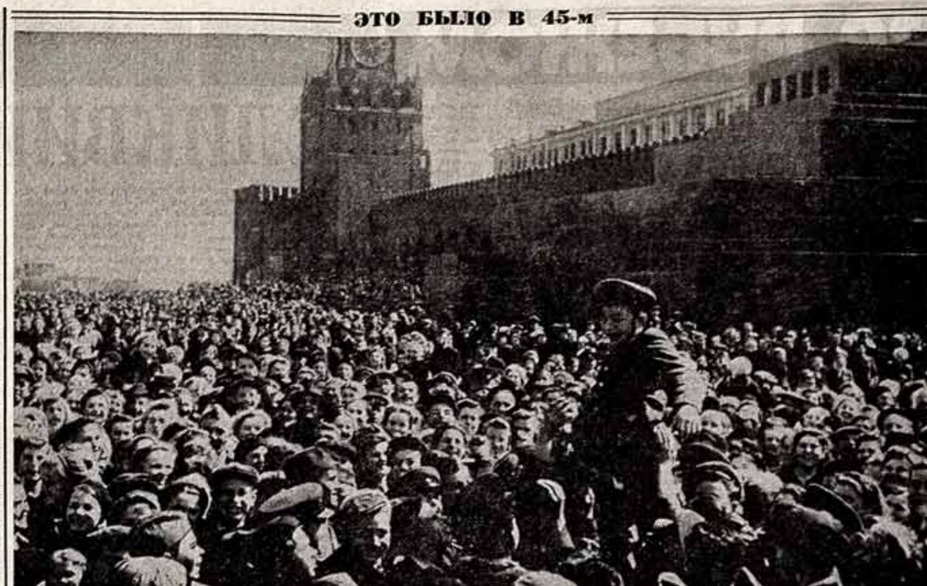
В День Победы на Красной площади в Москве.