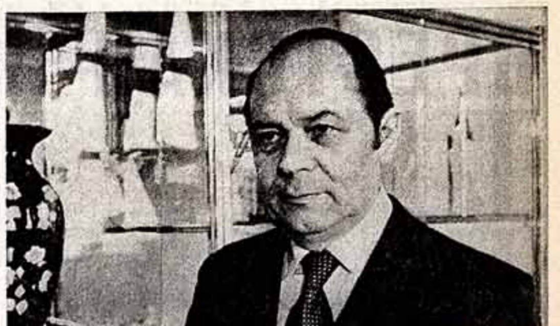
Люди искусства О МОЕМ ПАРТНЕРЕ Людмила КАСАТКИНА, народная артистка СССР

А. ЛЕБЕДЕВ, Д. РЫМАРЕВ, кинооператоры, лауреаты Государственных премий СССР.