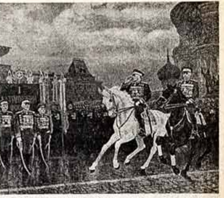
Документальные зарисовки фронтовых лет, проходящие через живо экспозицию, делают зрителя причастным к живой душе тех, кто вынес на себе войну. И как бы сегодняшние продолжители той давней портретной галереи — нынешние портреты ветеранов: полководцев и солдат — они тоже имеют войну. На выставке предстанут картины сражений, как много говорят они о людях войны, которые приходят в эти дни на выставку, и колоссально молодому, на знаменном войска. Бес дуг выставлен — ставшая человеческая задушевность: от сердца и сердцу идет повесть о том, что свято в народа. Я. Скарлик. Третьяк «Интеркомос». В. Преображенский. «Парад Победы».