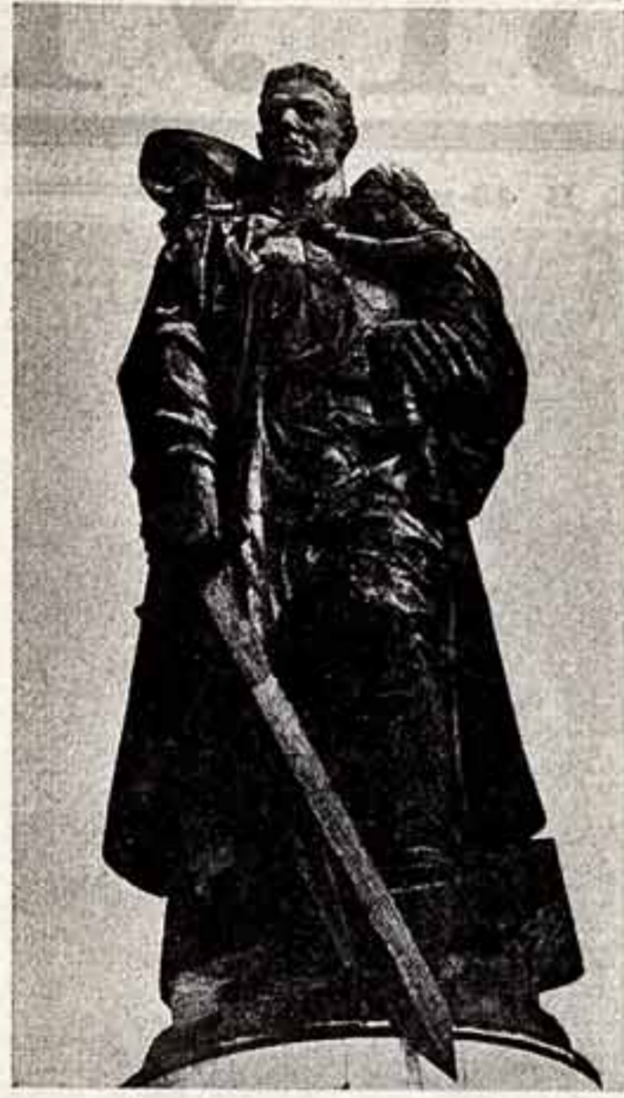
Вспомним: 31 января наши танки форсировали Одер, а 21 апреля части 3-й Ударной, 47-й и 5-й Ударной армий ворвались на окрестности Берлина...