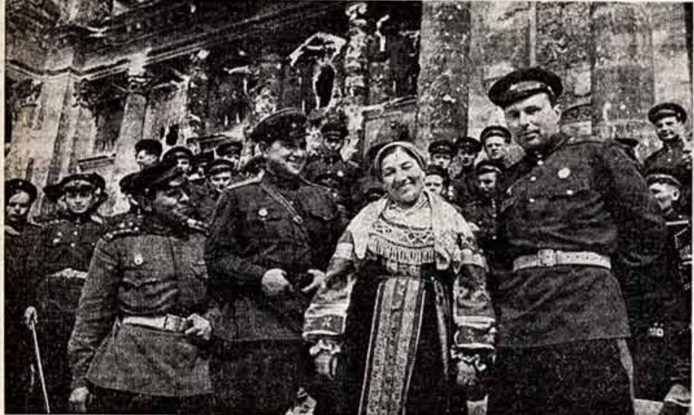
Известная певица Лидия Русланова после концерта для советских воинов в Берлине.