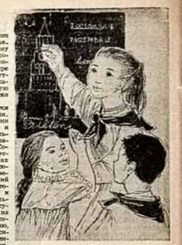
Рис. худ. А. ПЕТРОВСКОГО. ТРИПТИХ «В ознаменование годовщины Советского Союза АРЛУС» (Новый музей Бухарест).