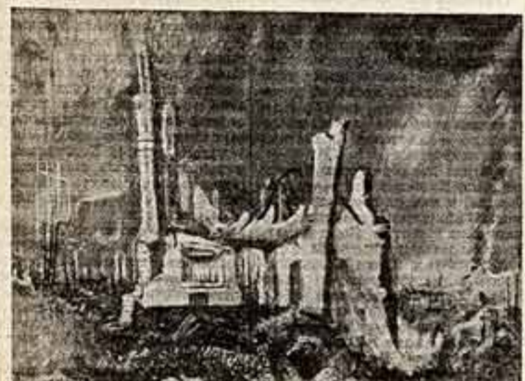
Эскиз художника Н. Шифрина и спектаклю «Сталинградцы» Ю. Чепурина в Центральном театре Советской Армии.