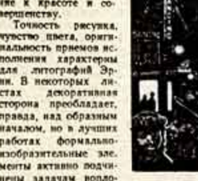
Г. Штруб. «Пять минут после полудня». Графика на дереве.

«Советская культура» выходит по вторникам, средам и субботам.