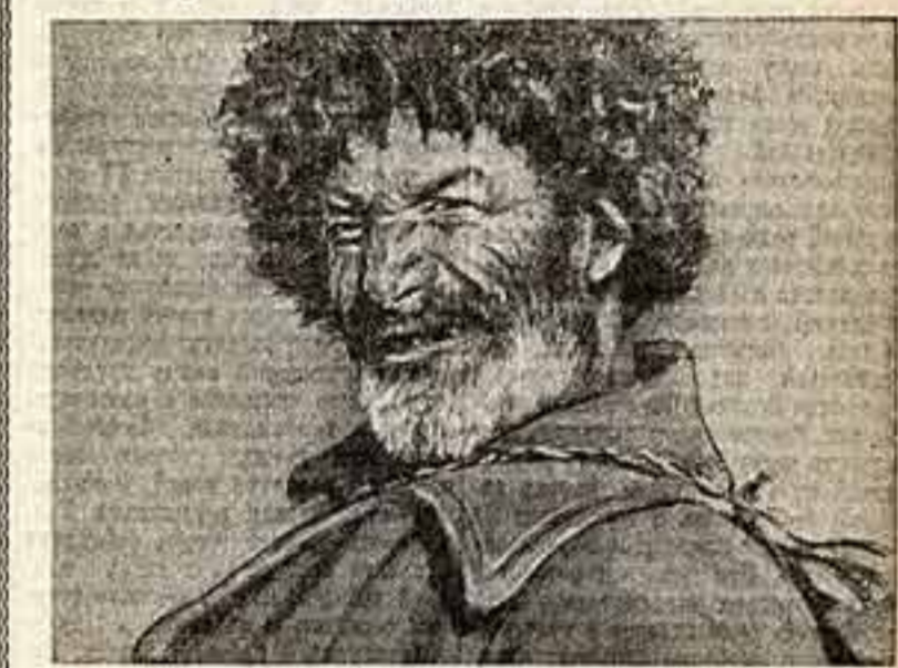
Г. Шахбази «Чабан».

В Центральном доме работников искусства открыта выставка произведений художников Адыгейской и Карачаево-Черкесии автономных областей. Представлено около ста работ — живопись, графика, скульптура, прикладное искусство.