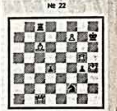
Мат в 3 хода. № 23. В. Краф, С. Сп, п. б2, h2; Ч. Краф, С1, п. h3. Мат в 4 хода.

№ 24. В. Краф, Кн3; Ч. Краф, К1, Кн5, п. e2. Мат в 3 хода. Три композиции Л. Куббеля (этюд составлен им в сотрудничестве с профессором-литературоведом О. Гербстманом). Этими заданиями начинается третий тур эстафетного шахматного соревнования Октября. Вы встретитесь с заданиями и этюдами, у которых год рождения — 1937-й.