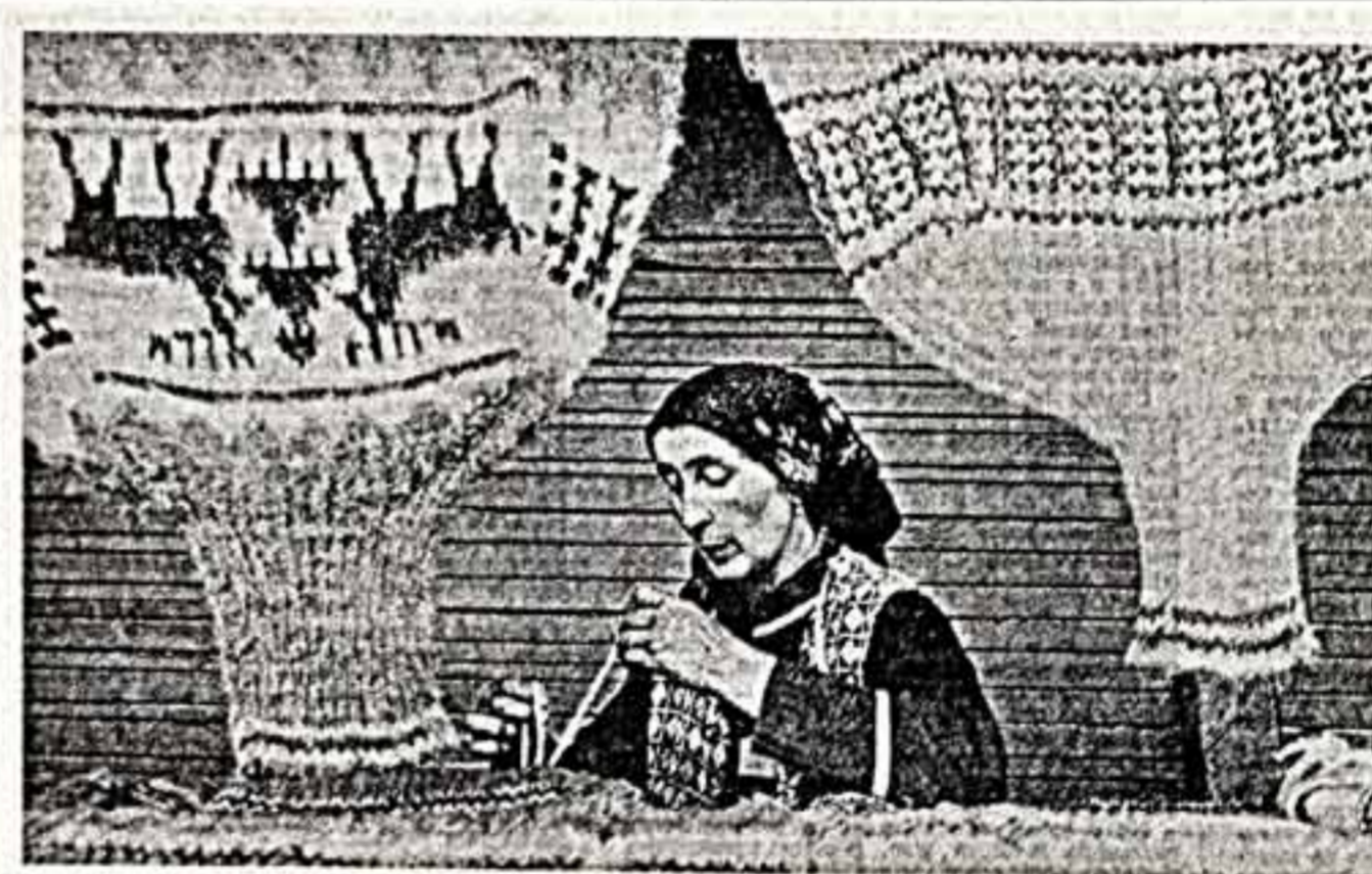
ФОТОКОНКУРС ● В. КОЛПАКОВ. «Золотые руки восточницы».