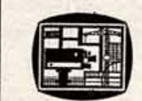
РАЗГОВОР ВЕДУТ ПРОФЕССИОНАЛЫ