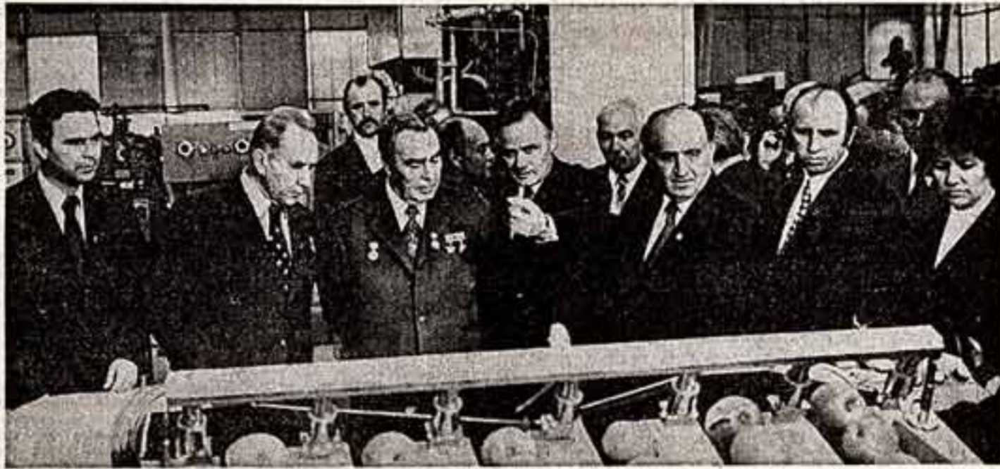
Во время осмотра юбилейной выставки НРБ.