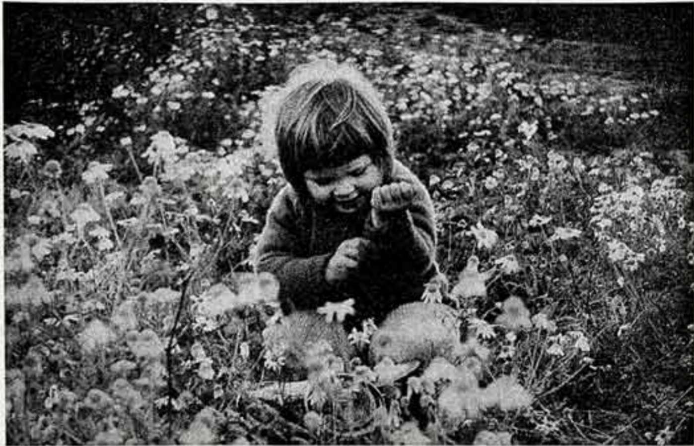
● Среди цветов.

Эта задача стоит сегодня перед партией и комсомолом. Перед каждым молодым человеком нашей страны.