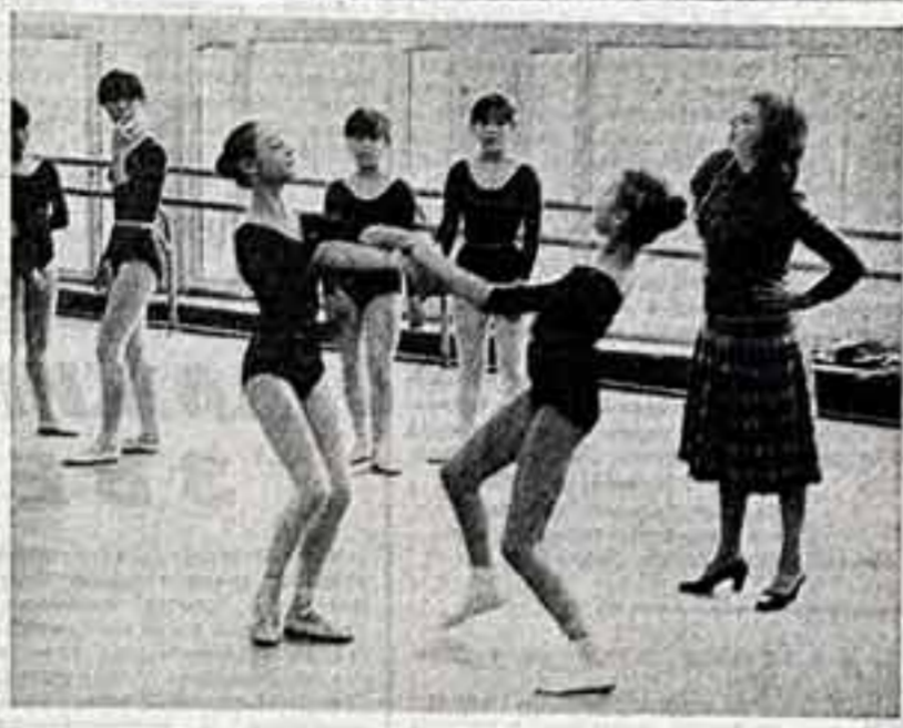
Киев и Киото — города-побратимы. Одни из преданных друзей Киевского хоробротического университета и Школы балетного искусства ТРАДА. В центре — представительница балетной школы из Киото была гостями Киевского хоробротического училища.

В течение недели проходили встречи, совместные репетиции, посещения концертов и театральные спектакли.