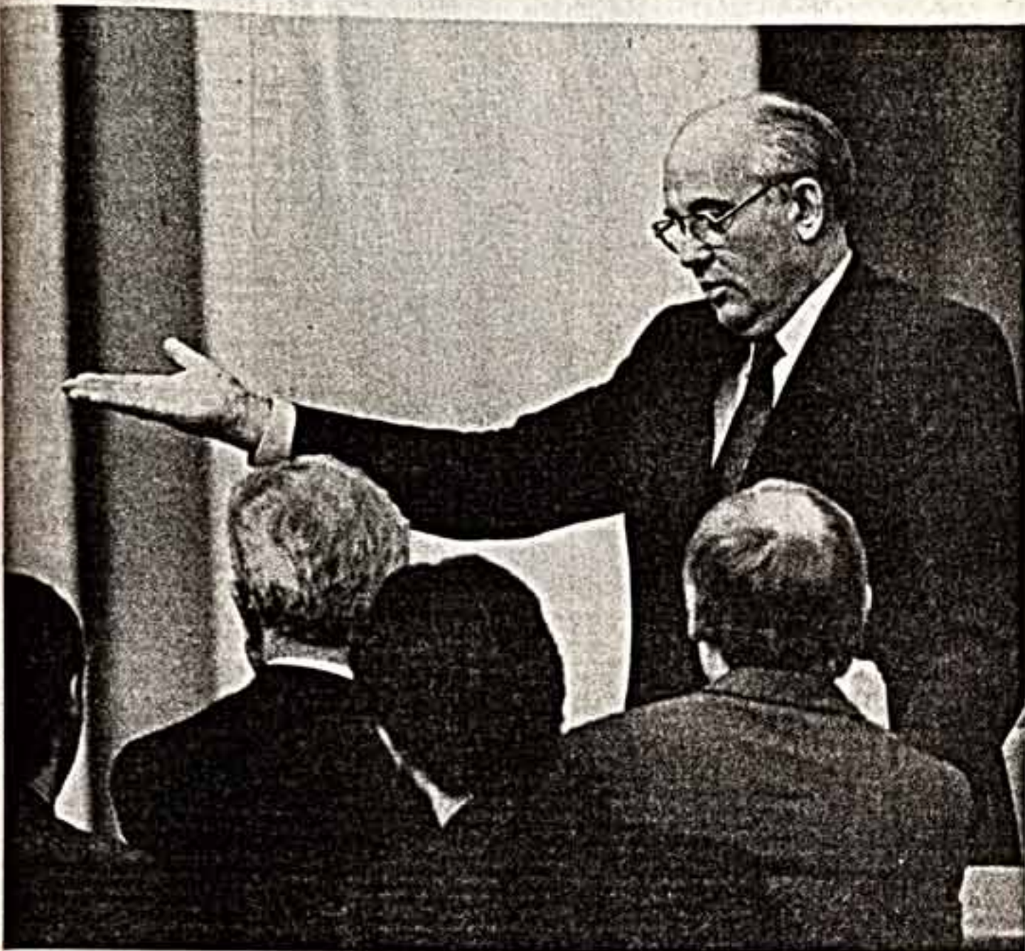
Москва. Второй Съезд народных депутатов СССР.