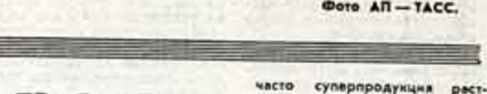
Фотопортрет Пола Ньюмена.

Известный американский актер в режиссер Пол Ньюмен выступает на митинге в Кембридже.