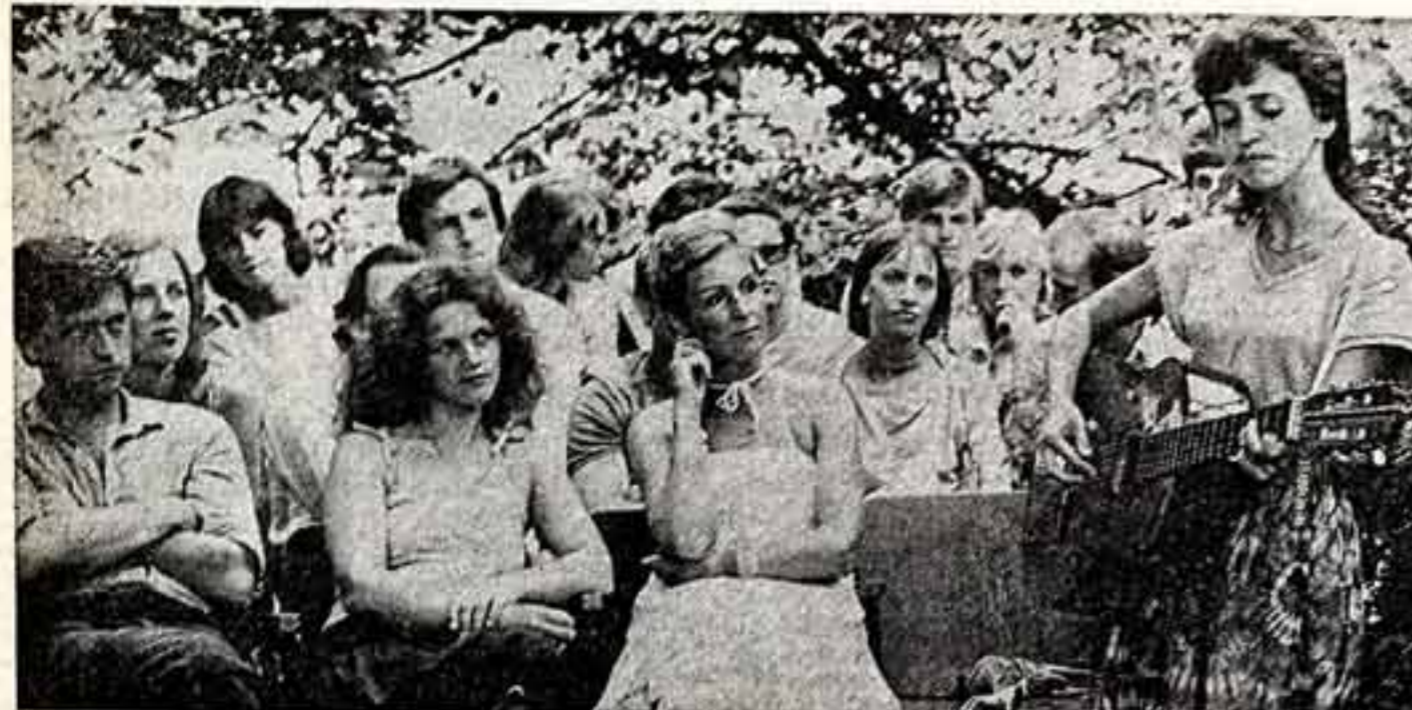
Летний лагерь творческой молодежи Латвии, организованной ЦИ ЛКСМ, собирает молодых художников, актеров, писателей, композиторов, кинематографистов.