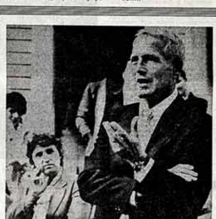
ПРОТИВ АНТИНАРОДНОЙ ПОЛИТИКИ БЕЛОГО ДОМА

В 22 километрах от столицы Мексики обнаружены останки древней цивилизации майя.