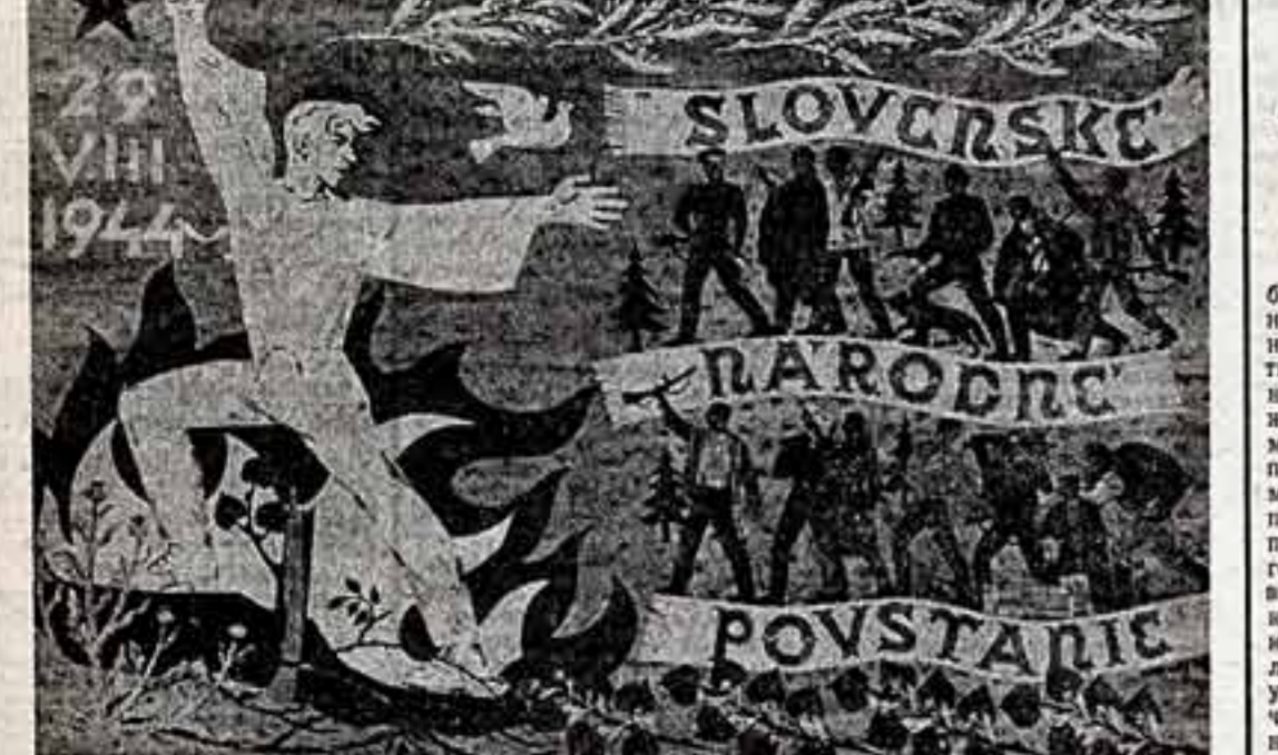
Пламя народной борьбы, героизм национального восстания, широкие партизанские движения...