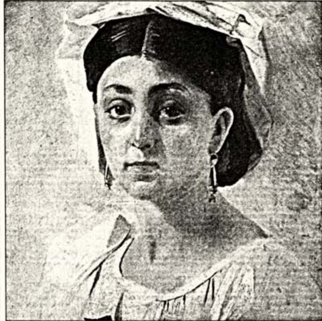
Вверху: Н.Ге. "Молодая итальянка в народном костюме". 1857 г. Внизу: "Замок на море". 1862 г.

Л.П. Сухопутная Толстая замечала, что на ее родственника замечание о бесконечности позитивных, отрицательных Ге от работы, он ответил: "Человек выше холста". В личности и творчестве Ге не было и тени самодовольства, высокомерия, наоборот — бесконечное смирение. При всей близости искусства романтизма, при всем восхищении своим кумиром Брюлловым лично ему была абсолютно чужда романтическая концепция гения и толпы, идея превосходства индивидуального таланта и культуры воображения. Он никогда