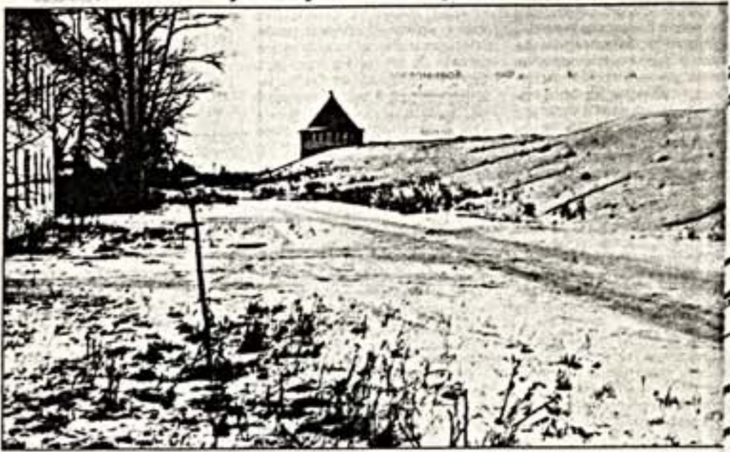
Вот, что осталось от древней крепости

Здесь начались уникальные реставрационные работы