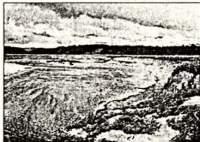
И. Остроухов. "Сибирь", 1890 г.