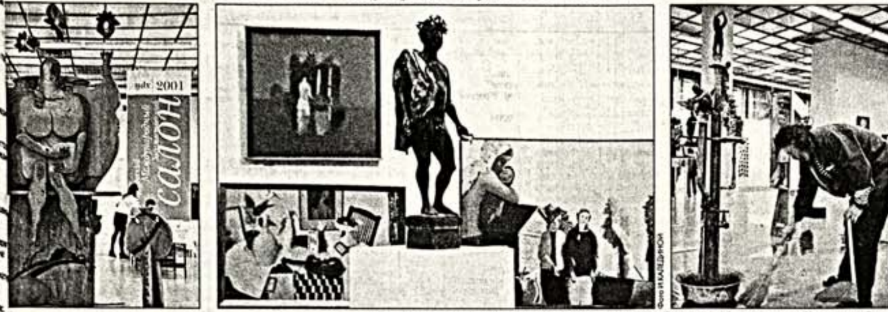
Вся панорама художественной жизни стран СНГ и Балтии представлена на Крымском Валу

Московский Международный художественный салон