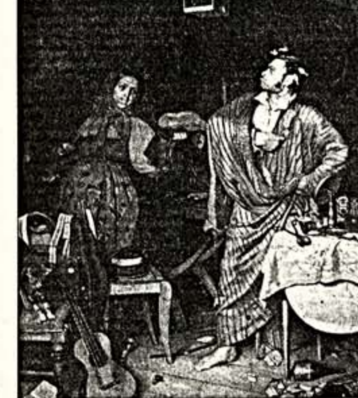
П.Федотов. "Свежий кавалер" (Утро чиновника, получившего первый крестик). 1846 г.

Кунсткамера русского быта в картинах Павла Федотова