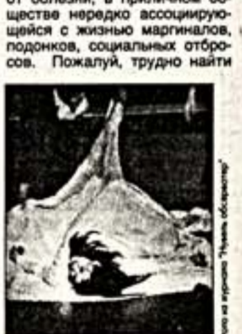
Сцена из спектакля "Дана с камелиями"

По сообщениям корреспондентов "Культуры" и ИТАР - ТАСС