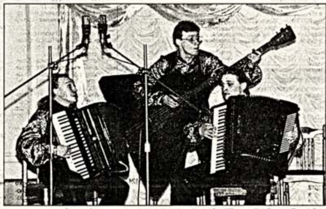
Ансамбль "Коллаж", г. Санкт-Петербург