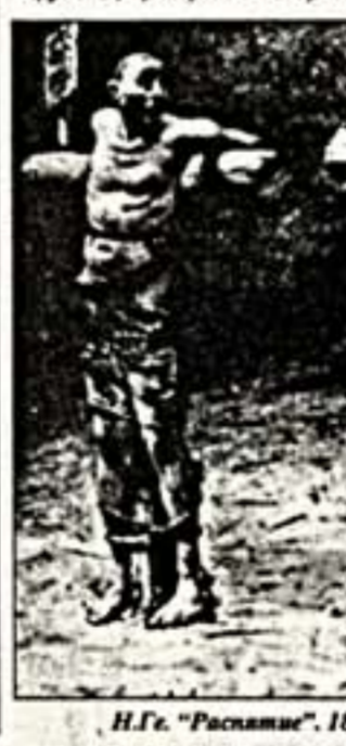
Н.Ге. "Распятие". 1894 г. Местонахождение неизвестно

После окончания выставки рисунки и рисунки вновь ушли за границу. Будет ли он еще когда-нибудь привезены в Россию? Но главное: какова судьба других работ Ге-сына, вывезенных в Швейцарию, например Портрета А.Л.Ге с сыном, Портрета Н.Г.Ге с сыном, других рисунков и эскизов, среди них, адресованных художником сыну Л.Н.Толстого?