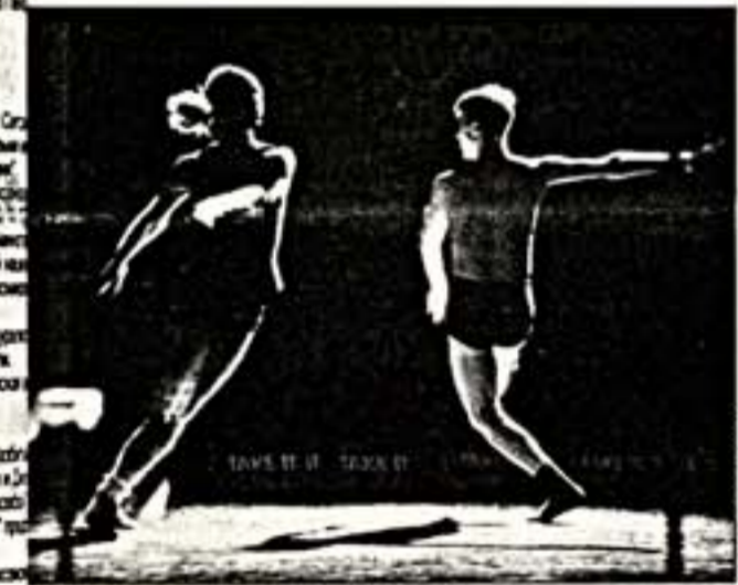
Сцена из спектакля "The Rogue Tool"