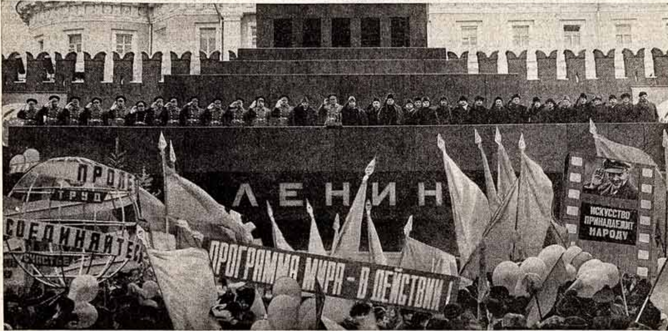
Москва, Красная площадь, 7 ноября 1973 года.