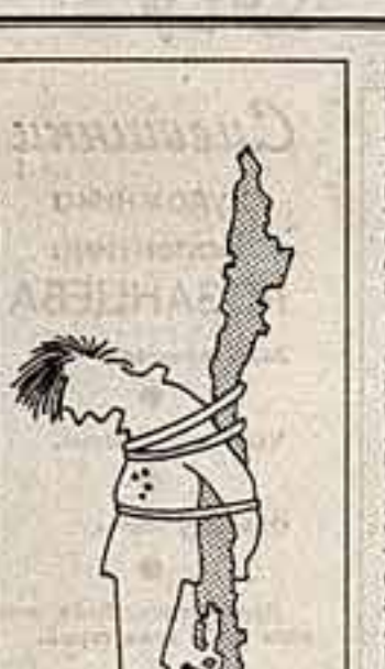
Рисунок Платки из французской газеты «Монд».

грудные клетки были расщеплены и штыки вновь — страшная пародия на вскрытие. Все они были молоды и все, судя по огрубелости их рук, из рабочей среды. Из общей груды едва заметно выдвинулись два девичьих тела. У большинства трупов были раздробленные головы. На следующий день я снова пришел в морт, на этот раз со своим приятелем-чилиецем в качестве свидетеля, тотый мог бы подтвердить