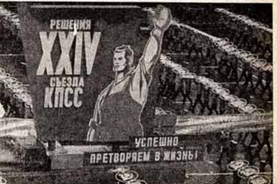
Марширует спортивная юность.