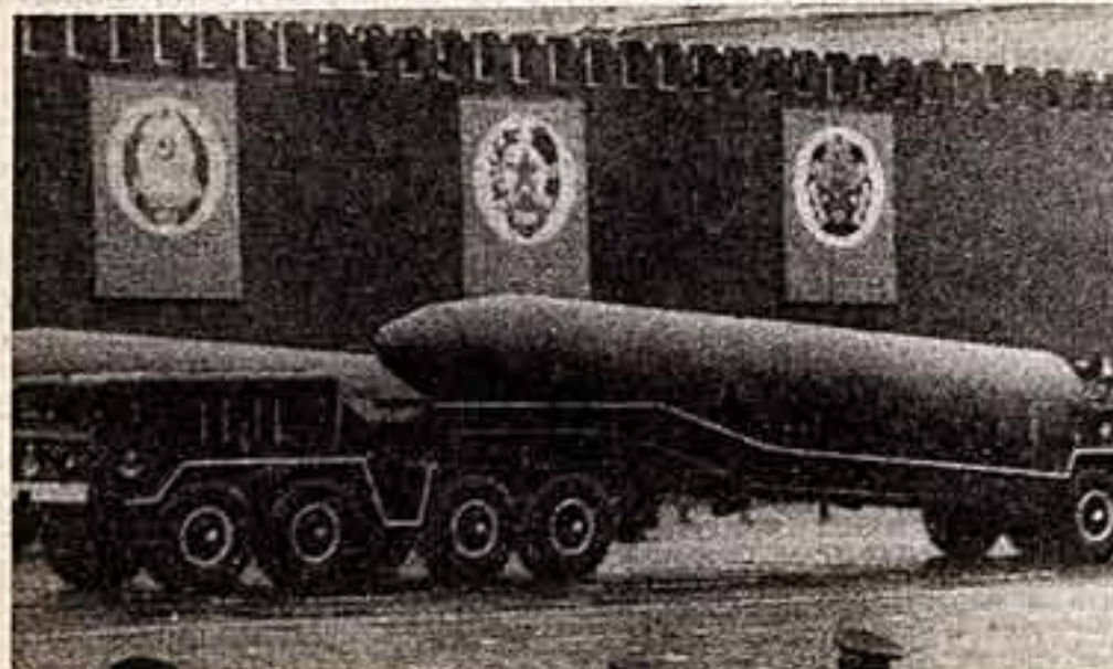
Праздничный парад войск.