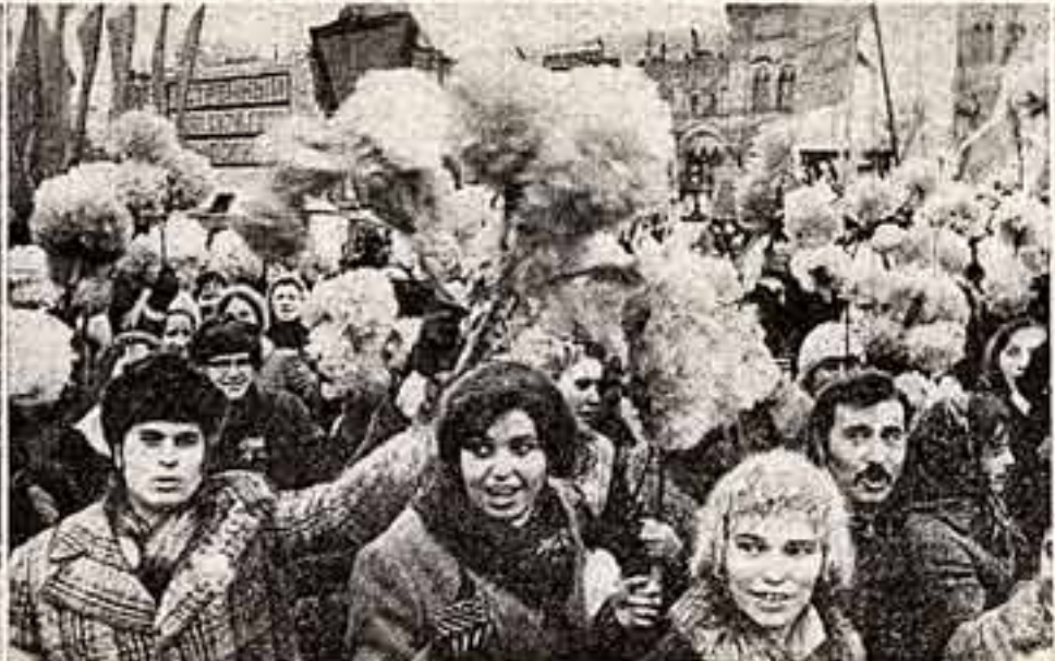
В колоннах демонстрантов столицы.