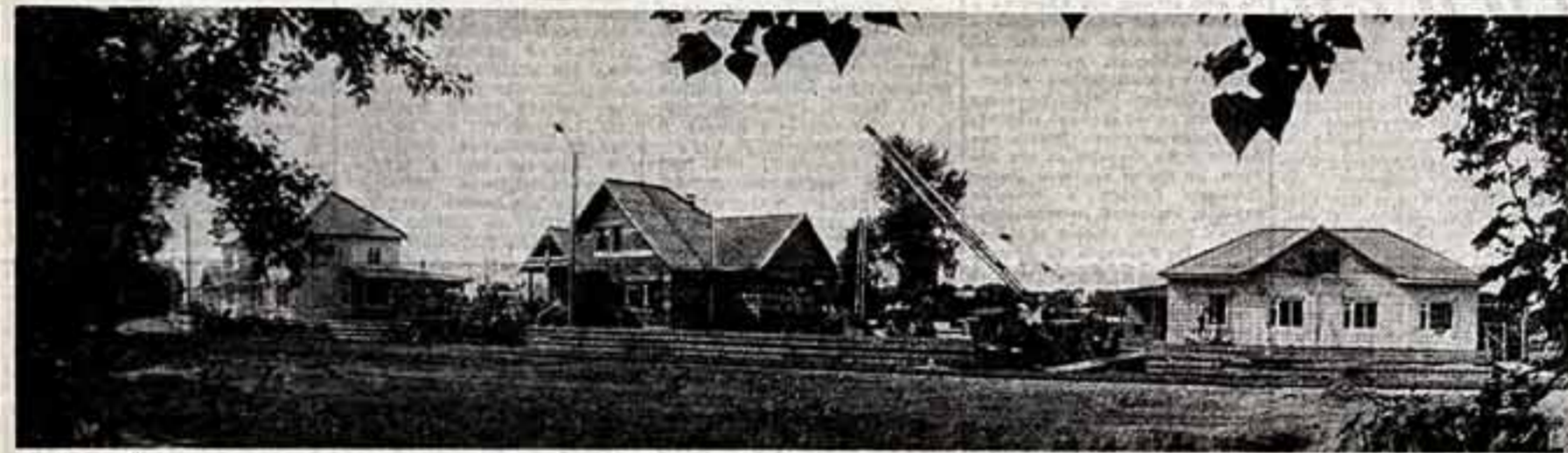
Стремительно меняется жизнь сибирских колхозов и совхозов, обновляются их облик. На месте старых сел и деревень растут благоустроенные поселки. Разумеется, в этом деле немало трудностей, проблем. Их и обсудили участники созванного в Красноярск совещания-семинара, посвященного улучшению жилищно-коммунального строительства и благоустройству сельских поселков Сибири и Дальнего Востока.