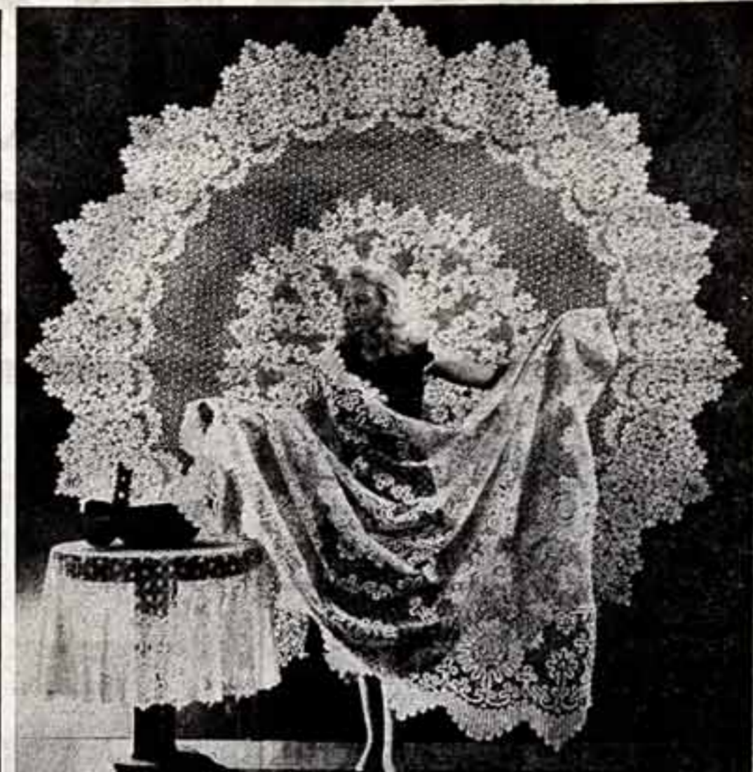
Продолжают поступать экспонаты во вновь открытый Всероссийский музей декоративно-прикладного и народного искусства.