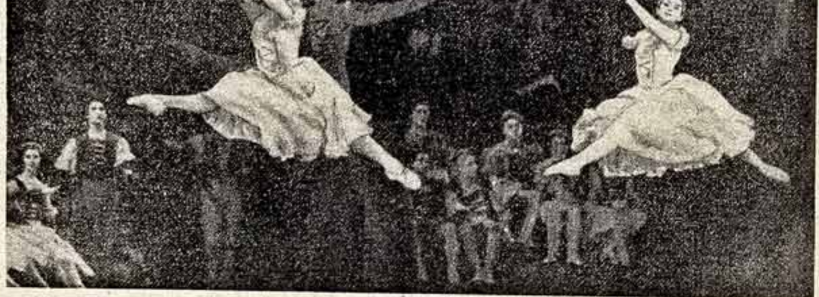
На сцене Кремлевского Дворца съездов выступают участники фестиваля «Русская зима» — артисты прославленной балетной труппы Большого театра СССР. На снимке: сцена из балета П. И. Чайковского «Лебединое озеро».

Здесь гости «Русской зимы» вновь встретились со своим любимцем — солнечным клоуном Олегом Поповым.