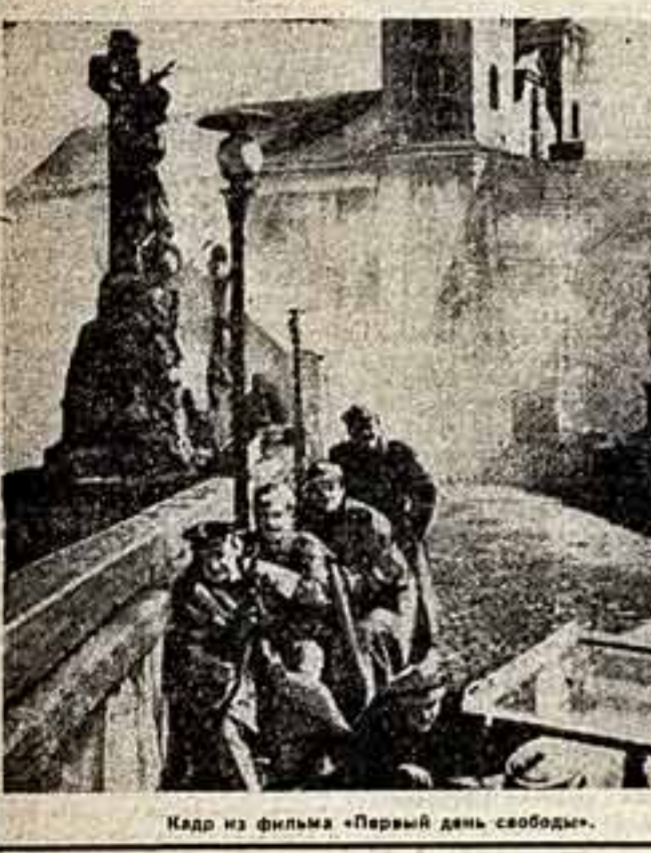
Кадр из фильма «Первый день свободы».

НА ЗАНЯТИИ Польши в кадре нового года вышел фильм «Первый день свободы» известного польского режиссера Александра Форда, создателя