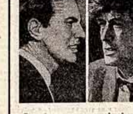
На снимке: Кристиан Бернард и Грегори Пек.