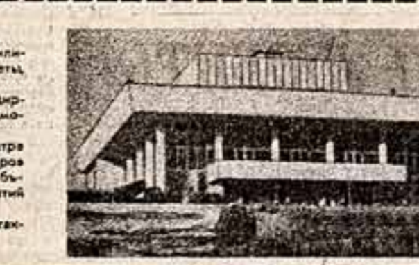
В Калининском районе культуры светит: в недавно сданном здании — просторные классы и кабинеты, хорший читальный зал и кинотеатрище.