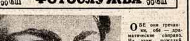
В БОЛЬШОМ операционном зале внезапно соварились...