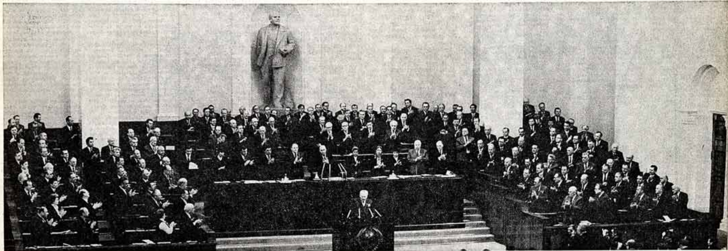
Москва, Кремль. 11 апреля 1984 года. Совместное заседание Совета Союза и Совета Национальностей Верховного Совета СССР одиннадцатого созыва.

ПЕРВАЯ СЕССИЯ ВЕРХОВНОГО СОВЕТА СССР ОДИННАДЦАТОГО СОЗЫВА