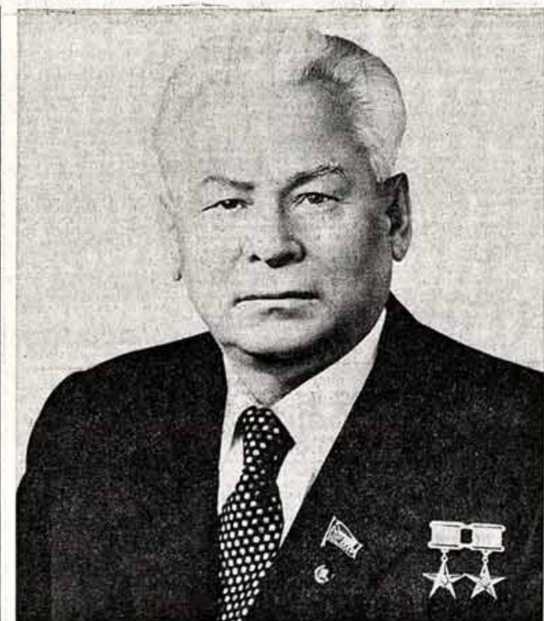
К. У. ЧЕРНЕНКО Председатель Президиума Верховного Совета СССР