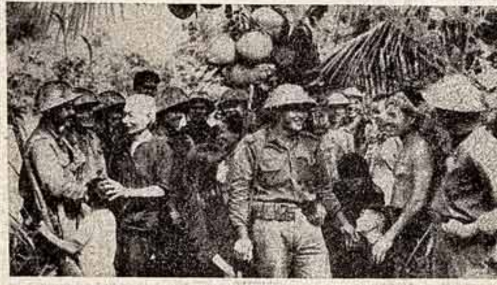
Фотоснимки, отражающие события, происходящие на территории Южного Вьетнама, также были сделаны кинодокументалистами НВСО.